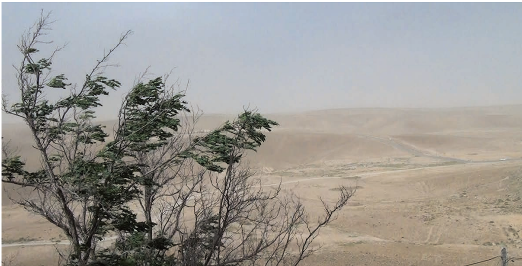
No Home Movie (2015)