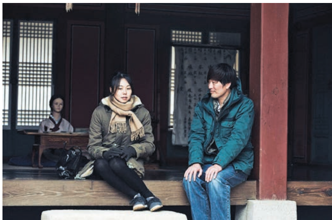
Right Now, Wrong Then (2015) Hong Sang-soo