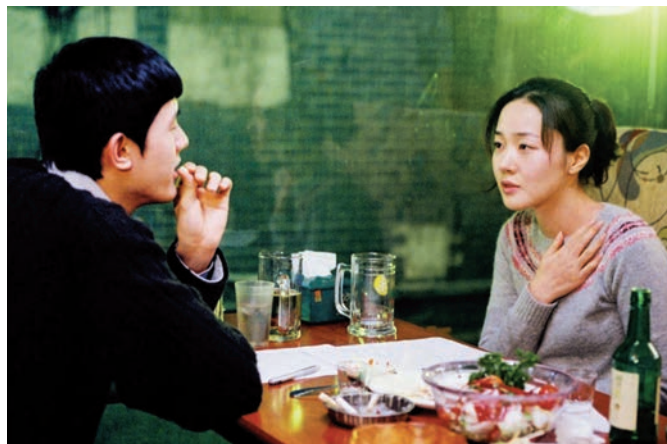
Tale of Cinema (2005)

La figure du réalisateur prolifique ne date pas d'hier. Certains, comme Rainer Werner Fassbinder, Jess Franco ou Steven Soderbergh, ont mis à profit leur productivité compulsive afin de bâtir une œuvre aussi imposante qu'hétéroclite. D'autres, comme Éric Rohmer, John Ford ou Yasujiro Ozu ont, au contraire, réussi à développer des univers cohérents, marqués par la répétition de motifs et de préoccupations thématiques.