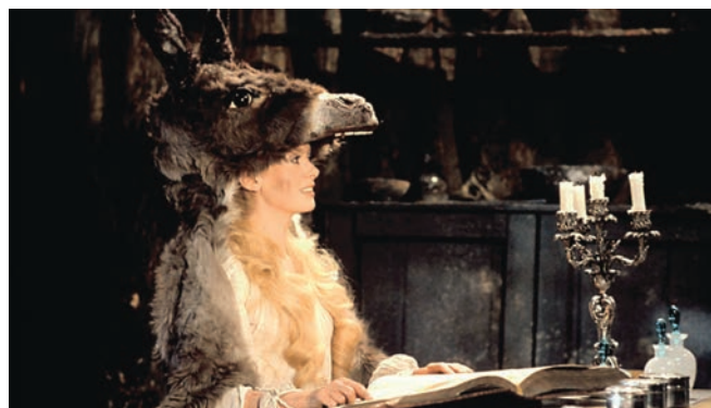
Le jour de l'éclipse d'Alexandre Sokourov (1988), Les êtres chers d'Anne Émond (2015) et Peau d'âne de Jacques Demy (1970)

pas payée pour figurer dans le film. Devant cette rencontre de la fiction et de la réalité, de l'individualité criante et de l'instinct grégaire, du spleen et de l'insouciance, je suis ébloui.