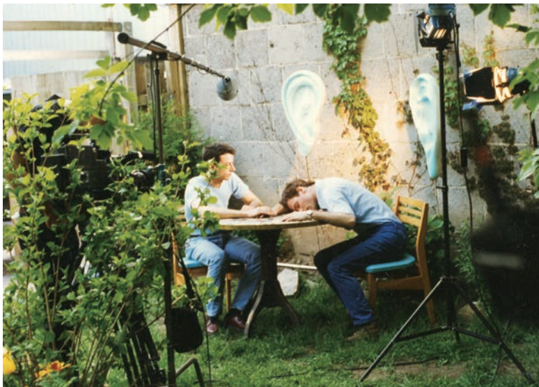
Tu dors (1999), photo de Charles Guilbert