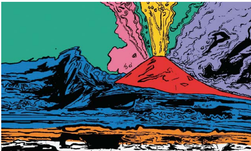
Vésuve d'Andy Warhol (1985)

L'état actuel de notre planète doit beaucoup aux volcans. La littérature aussi : le Marquis de Sade écrit dans la prison de la Bastille « Un jour, examinant l'Etna, dont le sein vomissait des flammes, je désirais être ce célèbre volcan », signifiant ainsi le pouvoir de l'imagination capable de faire imploser un trou noir pour que flamboie la forteresse du désir. La peinture : je tiens comme la plus belle œuvre d'Andy Warhol son « Vésuve » (1985) en éruption, rare fois où le peintre abandonne ses aplats colorés statiques pour que dansent de vives coulées multicolores. La musique, et tout à la fois le cinéma et la télévision, avec l'incroyable Pink Floyd: Live at Pompeii (63' - 1972) réalisé sous l'œil inquiétant du même Vésuve par le Franco-Écossais Adrian Maben ( https://vimeo.com/199425118 ). L'art vidéo aussi quand le Japonais Yoshi Sodeoka réinterprète ( https://vimeo.com/39349274 ) le film de Maben sous le titre One of these days, I'm going to cut your film into little pieces (5'50 - 2012).