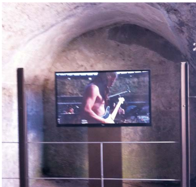
Pink Floyd: Live at Pompeii d'Adrian Maben (1972)

Et à présent, comme les musiciens, je me retire de l'amphithéâtre pour que seul demeure le désir: les seuls mots qui méritent d'exister sont ceux qui sont meilleurs que le silence. 24