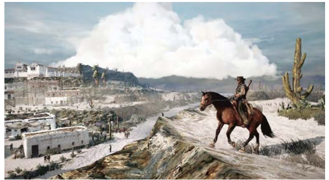
Jeu vidéo Red Dead Redemption

Sur un modèle similaire de structure narrative ouverte, la série Westworld se caractérise également par cette absence de position morale, et pousse à son paroxysme l'idée selon laquelle les visiteurs sont libres de suivre n'importe quel scénario imaginé par les organisateurs, et de s'adonner à tous les vices sans craindre de représailles de la part des hôtes. Plus qu'un parc d'attractions, Westworld est une zone de non-droit où la morale est un jeu et une affaire de préférence individuelle. Cette impunité totale des visiteurs du parc établit de fait une hiérarchie troublante entre les humains et les hôtes, et pose la question qui est au cœur de la série : à intelligence égale, comment différencier les hommes des androïdes ? Et surtout, dans un monde sans éthique