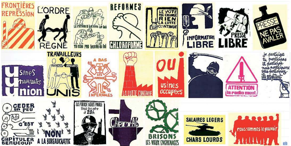
↑ Affiches de Mai 68 – Anti-K ↑ Affiche du film collectif Loin du Vietnam ↑ Couverture Le cinéma s'insurge n° 1 – États généraux du cinéma – Eric Losfeld éditeur – Le Terrain Vague 1968