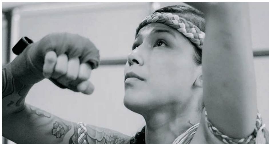
↑ → Emptying the Tank de Caroline Monnet (2018)