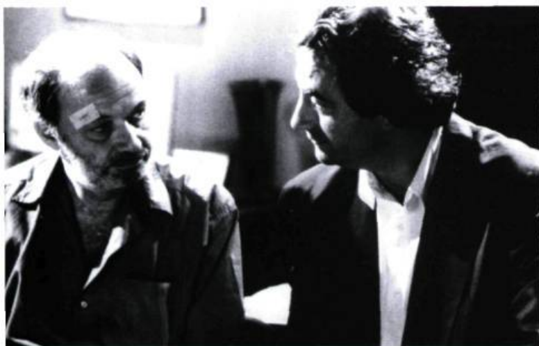
Claude Berri et Richard Bohringer dans Stan the Flasher de Serge Gainsbourg

Le continent africain était représenté par trois productions intéressantes quoique inégales: Zan Boko de G. Kaboré, Badis de M. A. Tazi et Le sixième doigt de H. Duparc (qui, par la