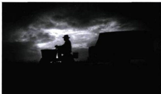
The Straight Story (1999).

L ynch a réussi l'exploit d'insuffler un rare degré d'abstraction au cinéma américain mainstream et d'élever de la sorte à des hauteurs insoupçonnées la puissance réflexive de l'image cinématographique, au risque de s'aliéner une part importante du public traditionnel, effrayé par la dimension expérimentale d'une œuvre sans concession, plus proche par certains aspects des tendances de l'art contemporain que de la production commerciale. Car s'ils donnent beaucoup à voir, les films de Lynch offrent peu de réponses aux questions qu'ils ne manquent jamais de soulever, ouvrant une brèche dans la rationalité du récit classique, drapant d'une voile de mystère la supposée transparence des représentations. Cela explique probablement pourquoi peu de corpus de cinéma ont suscité une exégèse aussi abondante, et provoqué dans la même foulée autant d'incompréhension. Fidèle à l'esprit d'une œuvre qui va en s'opacifiant à mesure qu'elle croît et gagne en maturité, Lynch a toujours refusé d'en fournir la clé, laissant entendre que ses films se suffisent à eux-mêmes et contiennent leurs propres explications.