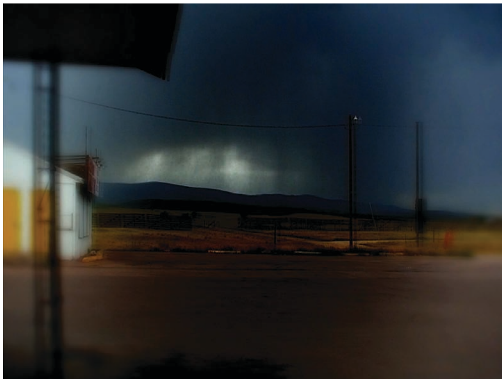
Autio (2010) de Nelly-Eve Rajotte

Et je terminerai par le début d'un des tout derniers textes du poète palestinien Mahmoud Darwich : « À l'écoute de la musique, des jardins s'ouvrent autour de moi et la mélodie devient une fleur que j'entends avec les yeux » (Musique visible). 📺