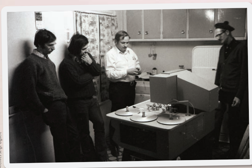
Archives Serge Giguère

Je photographie mon chum photographiant sa blonde dans mon premier studio de photo, quand j'avais 17 ans, dans le poulailler désaffecté chez nous. J'avais comme un regard documentaire avec du recul? En tout cas, un éclairage de bon goût dans des «gallons» de sirop d'érable perforés (sourire).