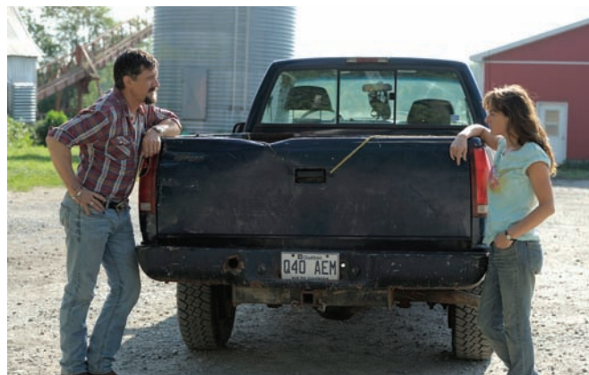
Nuit # 1 (2011) d'Anne Émond et Marécages (2011) de Guy Édoin