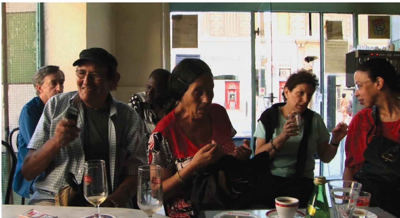
La république (de la série « La république Marseille »)