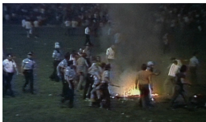
The Last Days of Disco (1998)

de la transition politique de l'Espagne franquiste à la démocratie. Et le titre même du dernier volet de la « trilogie » est vaguement apocalyptique ; les images d'archives de la fameuse Disco Demolition Night de 1979 qui y sont incluses, dans lesquelles on peut voir un panneau portant la mention « Disco sucks ! » témoignent d'ailleurs effectivement de la fin d'une époque. Le passage du temps semble condamner la classe bourgeoise et ses aspirations. Qui plus est, ce sont les idéaux démocratiques et égalitaires mêmes ayant permis son avènement qui, à présent, garantissent son déclin. La nature fondamentalement démocratique de la société américaine offre en effet à chacun la possibilité d'en gravir les échelons ; la face cachée de cet avantage est la rapidité avec laquelle peut survenir le déclin d'une bourgeoisie dont aucun titre ne protège les privilèges. Cette possibilité, les protagonistes de Stillman en sont des plus conscients et, alors que les personnages de Metropolitan ne font que l'anticiper, ceux de The Last Days of Disco l'affrontent de