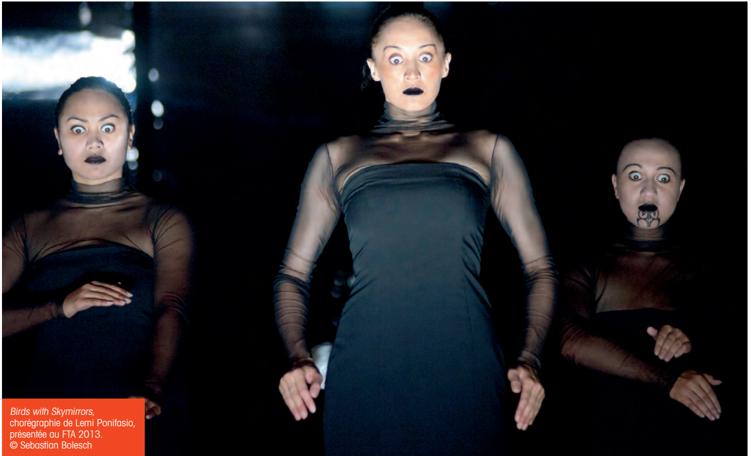
Birds with Skymirrors , chorégraphie de Lemi Ponifasio, présentée au FTA 2013.