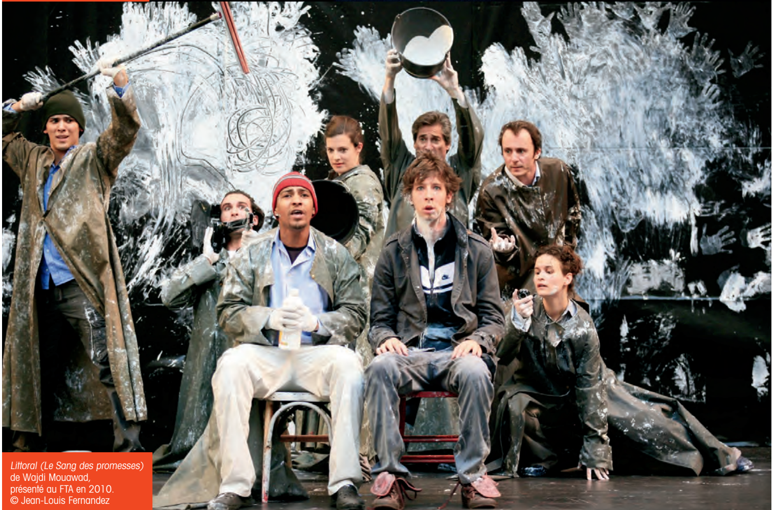
Littoral (Le Sang des promesses) de Wajdi Mouawad, présenté au FTA en 2010.