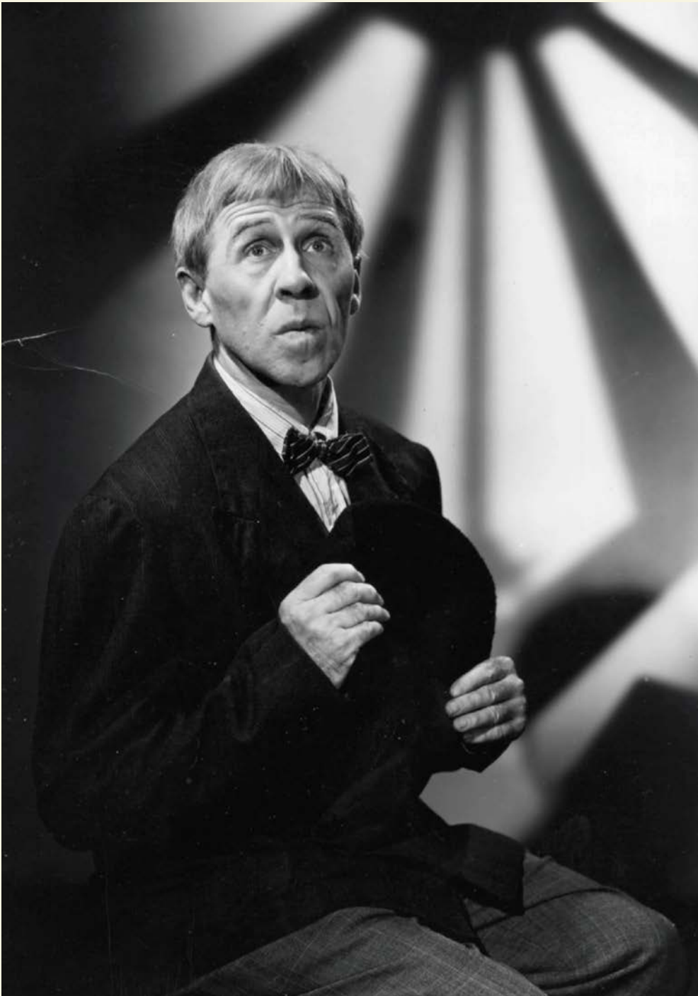
Gratien Gélinas dans le rôle-titre de Bousille et les justes (1959).

Fridolinou-le-sympathique-partisan-des-Canadiens ? Difficile de s'avouer que c'est mieux vu d'aller entendre du théâtre écrit par des gars (souvent des gars) de moins de 40 ans au regard ténébreux qui portent une à-peu-près-barbe, une casquette de trucker et un t-shirt avec une camionnette dessus !