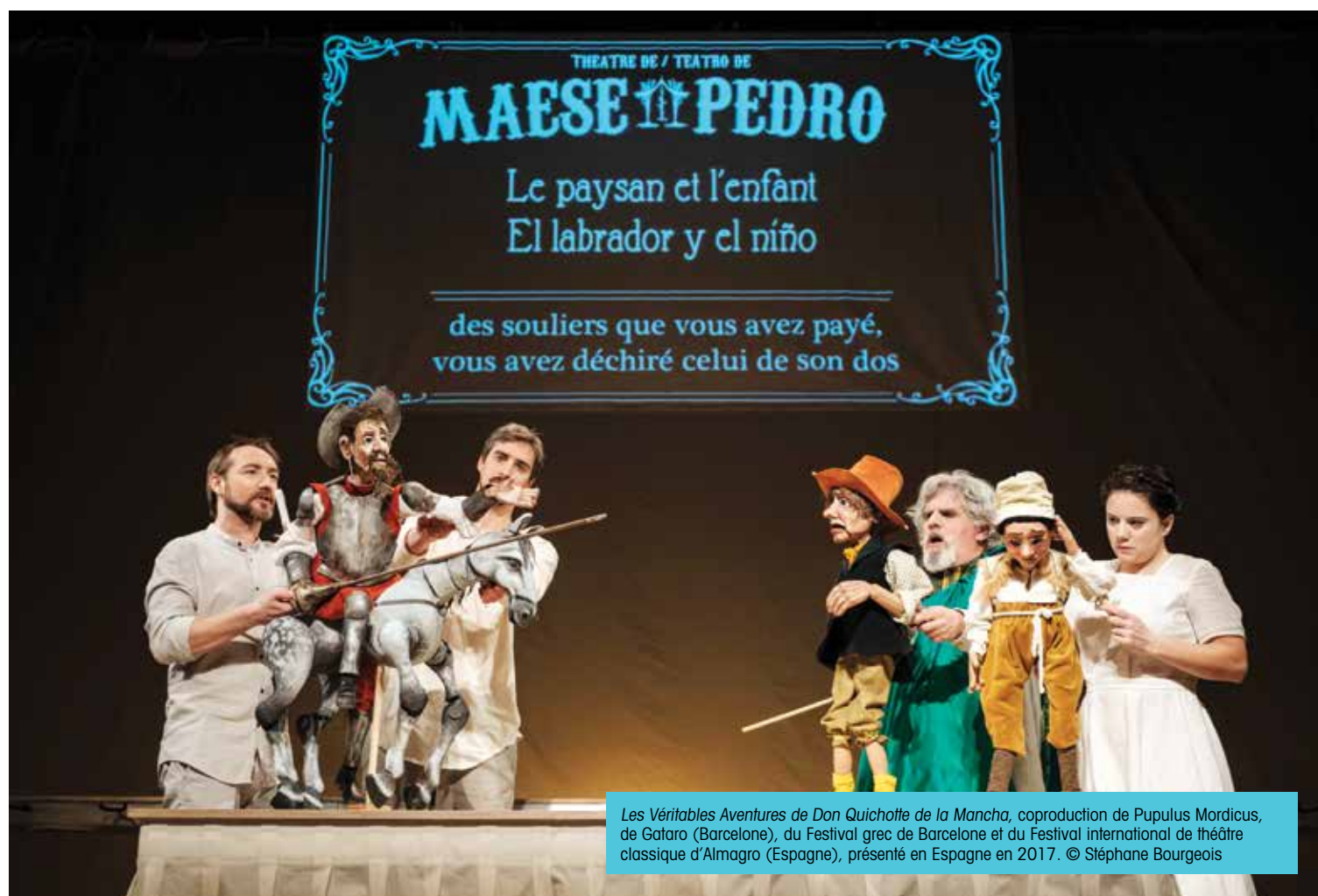
Les Véritables Aventures de Don Quichotte de la Mancha, coproduction de Pupulus Mardicus, de Gataro (Barcelone), du Festival grec de Barcelone et du Festival international de théâtre classique d'Almagro (Espagne), présenté en Espagne en 2017.

S'ils ne sont pas toujours prophètes en leur pays, les marionnettistes québécois sont acclamés partout ailleurs. Les Sages Fous, de Trois-Rivières, sont en tournée en Europe à peu près six mois par année. Pour cela, un camion et des décors sont remisés près de Limoges, en France. Plutôt que d'attendre que les spectacles soient présentés au Québec, les Sages Fous préfèrent les exporter en Europe. En misant sur une présence soutenue, ils donnent à leurs spectacles plus de chance d'être vus et de séduire de nouveaux interlocuteurs. Cet ancrage local donne à la compagnie une grande réactivité: pour les