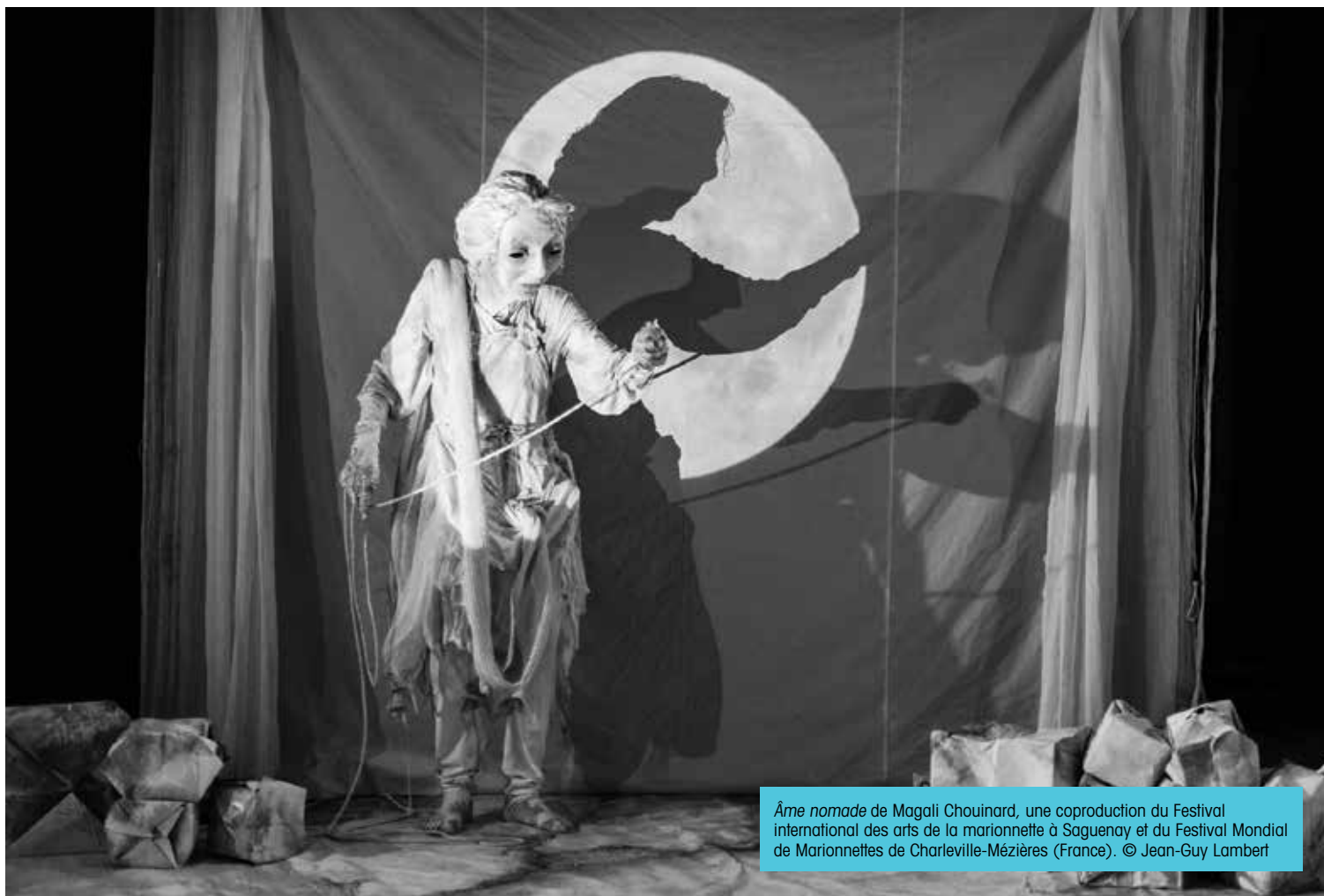
Âme nomade de Magali Chouinard, une coproduction du Festival international des arts de la marionnette à Saguenay et du Festival Mondial de Marionnettes de Charleville-Mézières (France).

deux, comme Pupulus Mordicus qui, pour Les Véritables Aventures de Don Quichotte de la Mancha , a réalisé une coproduction avec une compagnie de Barcelone, Gataro, et deux diffuseurs, le Festival grec de Barcelone et le Festival international de théâtre classique d'Almagro, ce qui leur a permis de jouer en Espagne pendant un mois en juillet 2017.