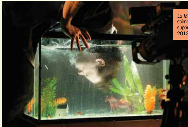
La Mouette d'Anton Tchekhov, mise en scène par Christian Lapointe (École supérieure de théâtre de l'UQAM, 2013).

veut enlever une barrière psychologique pour que le flot de paroles coule; qu'il n'y ait pas un "temps psychologique", entre ce que tu dis et ce que tu fais.»