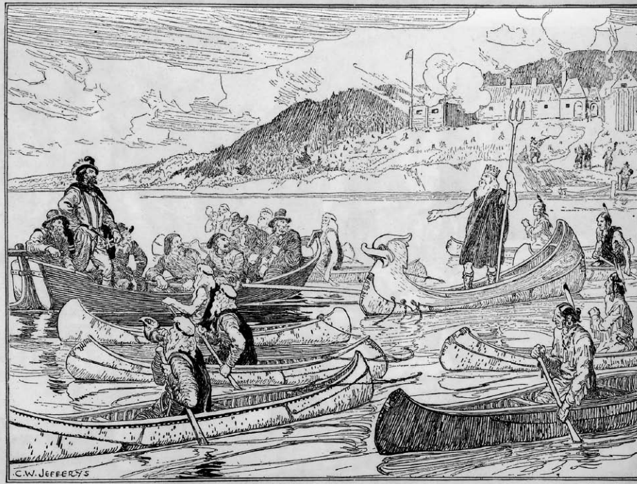
Le Théâtre de Neptune en la Nouvelle-France de Marc Lescarbot, première pièce présentée en Amérique française, a été donnée à Port-Royal en 1606. Illustration tirée de The Picture Gallery of Canadian History de C.W. Jefferys, vol. 1, Toronto, The Ryerson Press, 1942, p. 83.

mélioratif ou péjoratif sur le sociolecte des personnages. L'absence d'un véritable dialogue entre les locuteurs de langues différentes en constitue le second trait. Syndrome de Babel, si l'on veut. C'est avant que l'on ne présente sous un jour heureux, postmodernisme ou multiculturalisme aidant, cette hybridité linguistique, cette hétéroglossie. Point de vue que les artisans de la scène mettront beaucoup de temps à adopter au Québec, particulièrement les francophones, puisque la langue parlée rend aussi compte des rapports de force et des tensions sociales travaillant la cité.