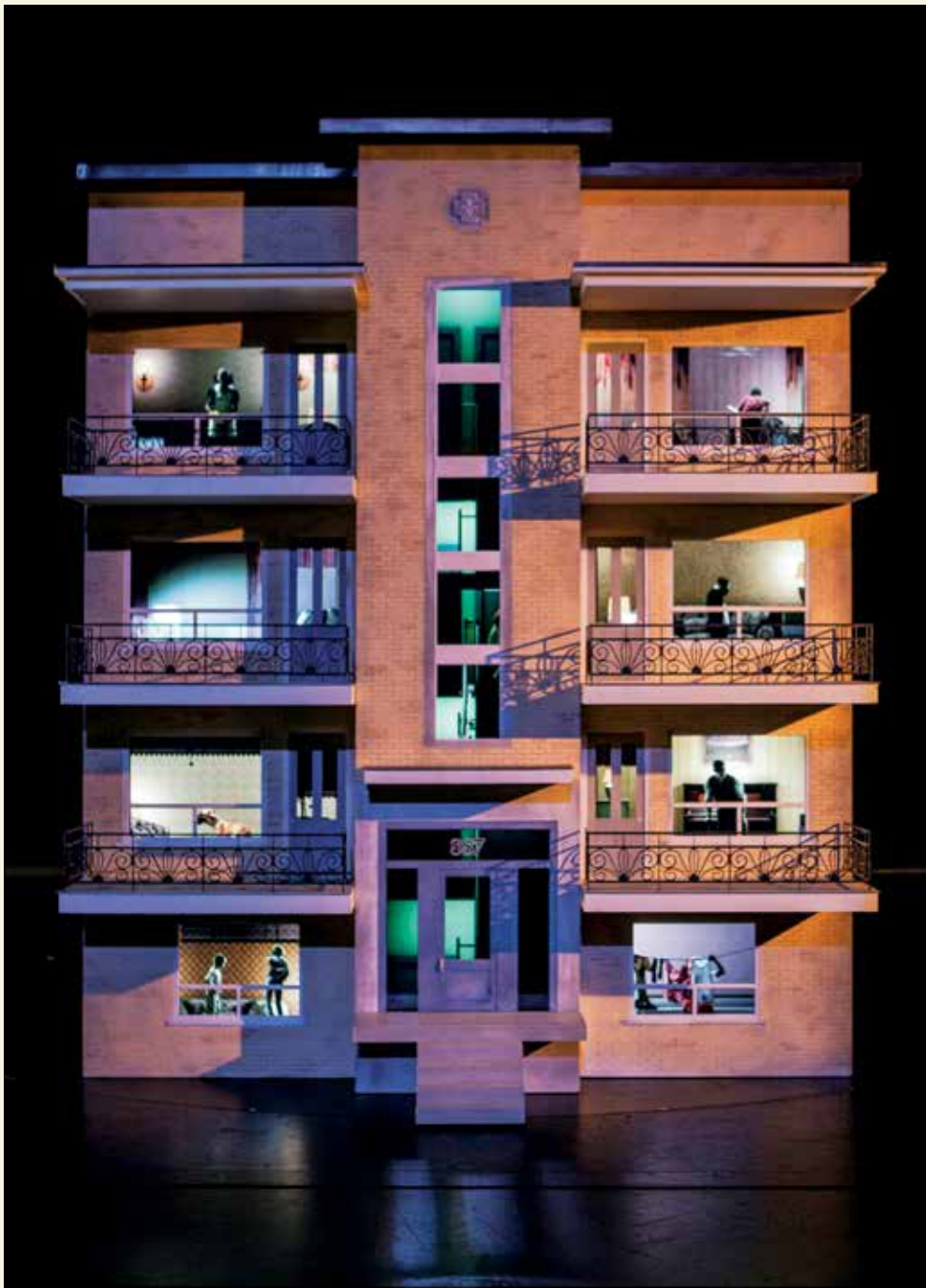
887, texte, mise en scène et interprétation de Robert Lepage (Ex Machina). Conception des images : Félix Fradet-Faguy. © Félix Fradet-Faguy

collaboration avec le ou la scénographe, il cherche souvent à « faire en sorte qu'on oublie l'écran le plus vite possible. Ce que j'aime le plus, c'est utiliser des écrans qu'on ne perçoit pas comme tels. » Il prend plaisir à devoir s'adapter à une proposition scénographique.