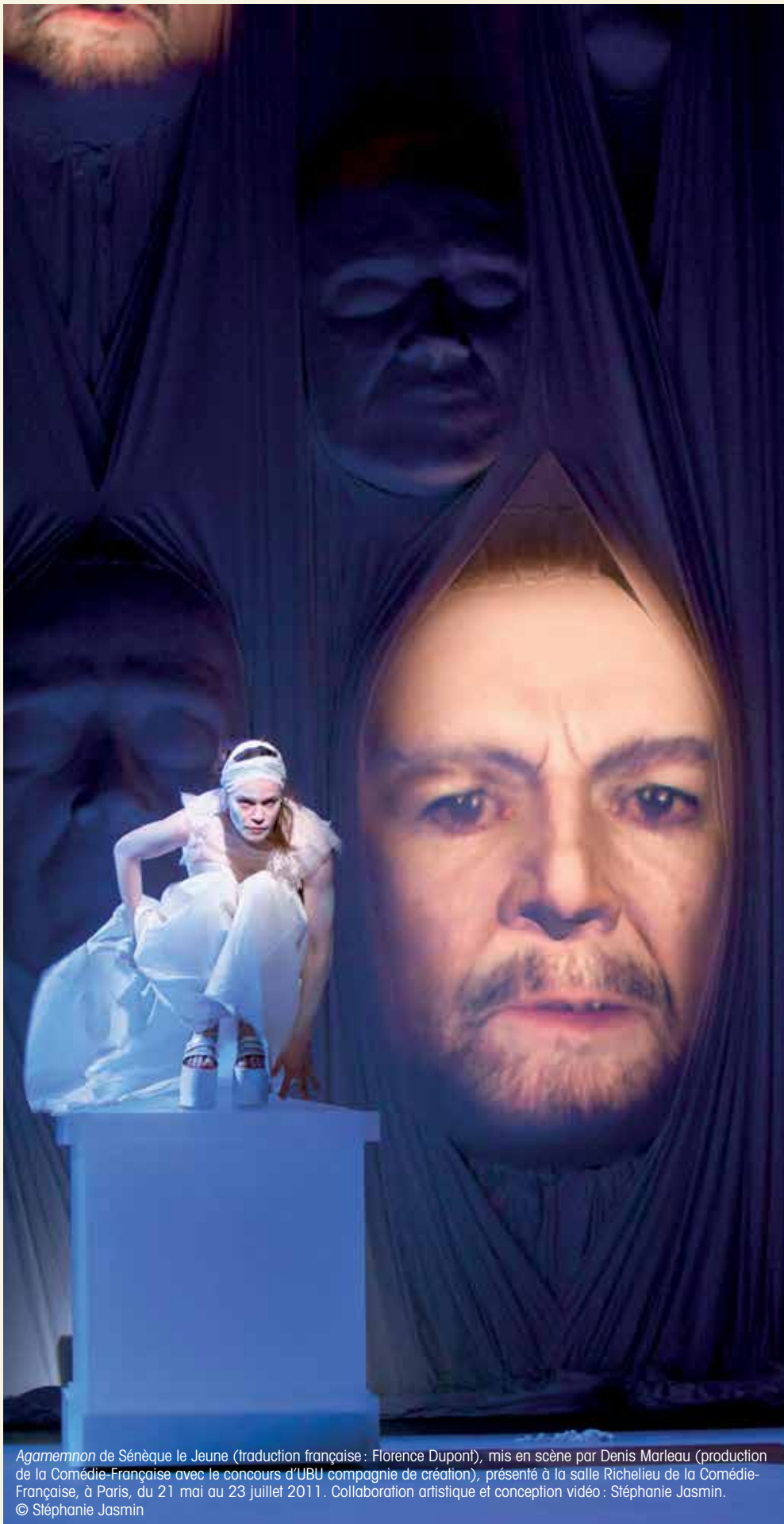
Agamemnon de Sénèque le Jeune (traduction française : Florence Dupont), mis en scène par Denis Marleau (production de la Comédie-Française avec le concours d'UBU compagnie de création), présenté à la salle Richelieu de la Comédie-Française, à Paris, du 21 mai au 23 juillet 2011. Collaboration artistique et conception vidéo : Stéphanie Jasmin © Stéphanie Jasmin