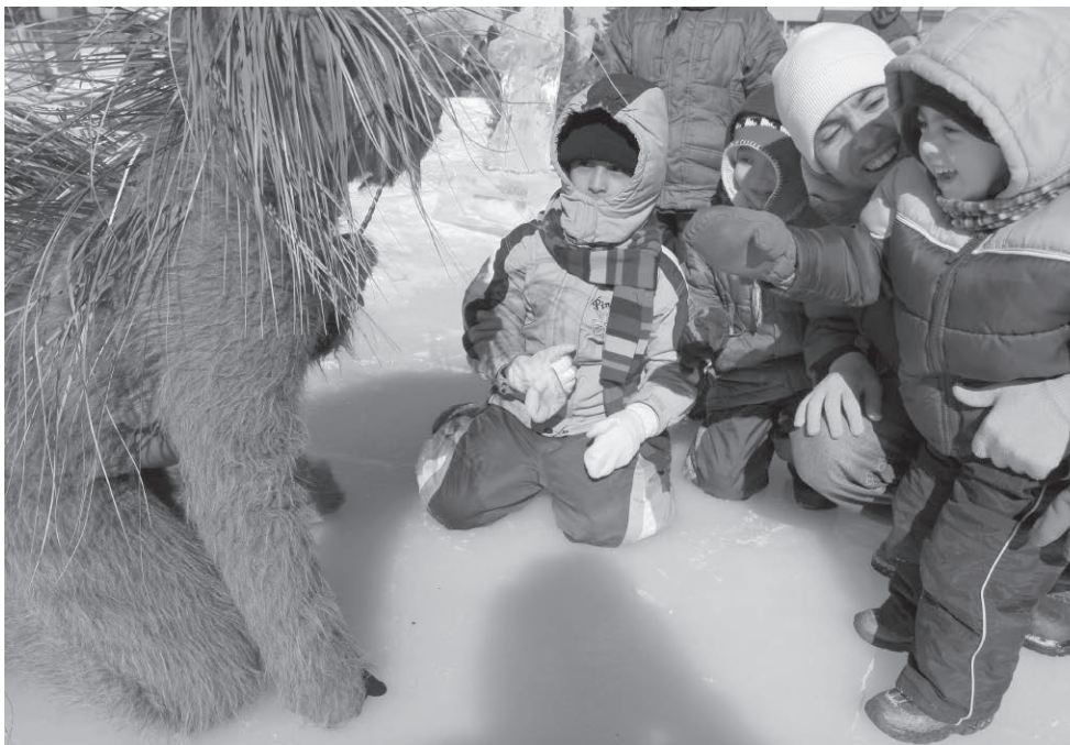
Les Kraas lors de l'événement « L'hiver en fête » organisé par la maison de la culture Villeray-Saint-Michel-Parc-Extension en 2009.

L'acteur et le public du théâtre de rue sont complices et partenaires. On se voit dans les yeux, on s'entend respirer, dans un espace où nous n'avons pas la protection du quatrième mur ou celle du noir. Le spectacle est ancré dans la vie et s'inscrit dans l'espace du quotidien : le gamin qui cherche sa mère, la vieille qui traverse le cercle, le jeune qui lâche une bêtise en font partie.