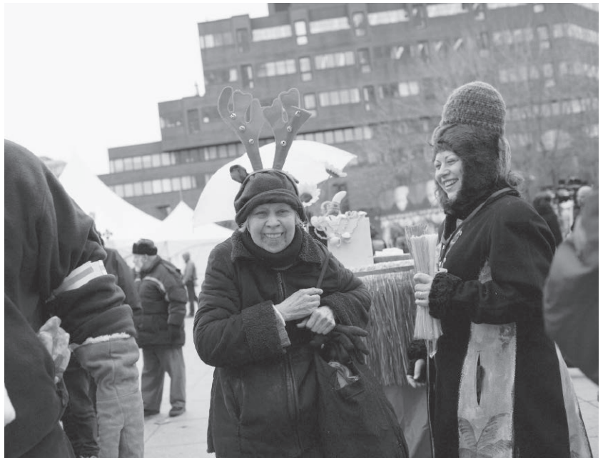
Toxique Trottoir participant à l'État d'urgence 2010, organisée par l'ATSA sur la place Émilie-Gamelin à Montréal.

Il se tisse alors un vrai sentiment d'appartenance au projet. Par exemple, quand nous prenons les citoyens d'un quartier en photos pour les exposer après de façon insolite sur le mobilier urbain pendant le Festival international des arts de la rue « la Rue Kitétone ».