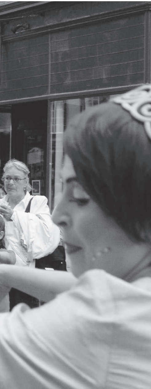
Les Esthéticiennes de l'âme au Festival d'été de Québec en 2007.