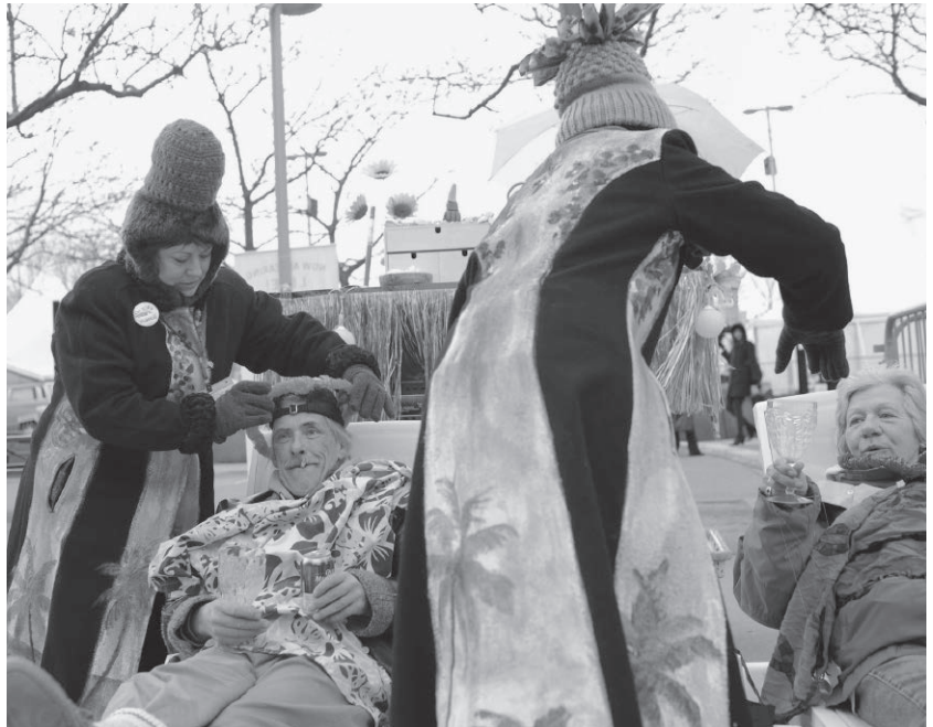
Toxique Trottoir participant à l'État d'urgence 2010, organisée par l'ATSA.

Alors, le vrai spectateur va en général prendre parti, dénoncer, fustiger, engueuler l'acteur invisible.