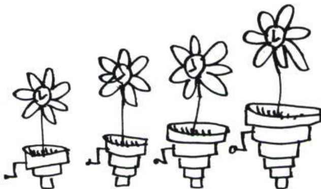
Les ludiques fleurs en pot de O Que Diz Molero . Dessin tiré du programme.