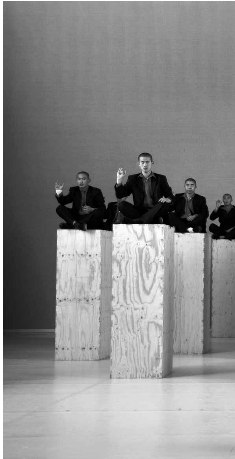
Sutra de Sidi Larbi Cherkaoui, avec les moines du temple Shaolin, présenté à Danse Danse en novembre 2009.