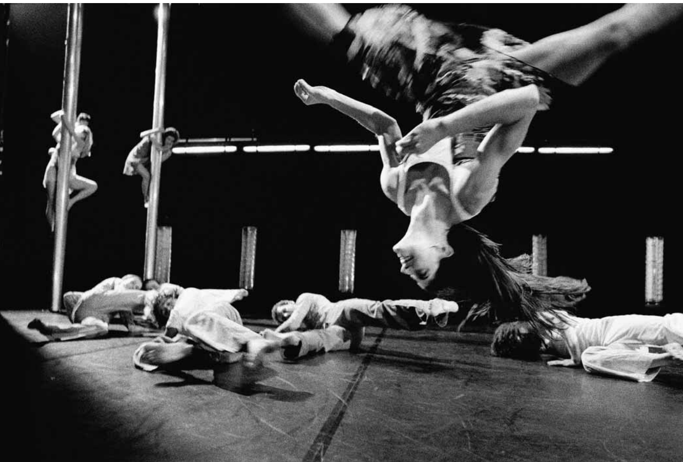
Blush de la compagnie Ultima Vez, présenté à Danse Danse à l'hiver 2005.

différentes grandes compagnies ne doivent pas grand-chose, et souvent même rien, à l'énorme marché du divertissement américain.