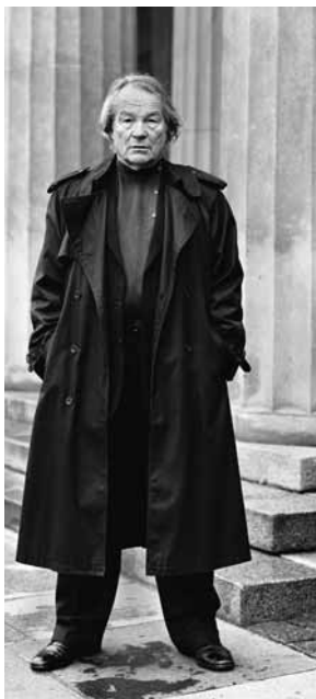
Peter Stein, Prix Europe pour le théâtre 2011.