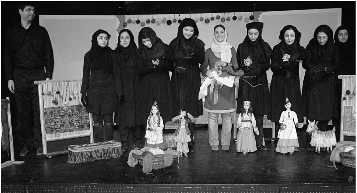
Salut des marionnettistes à l'issue d'un spectacle présenté au Festival international de théâtre Fajr, à Téhéran, en février 2011.

Par ailleurs, les comédiennes portent la plupart du temps plusieurs couches de foulards, au cas où. Le premier, apparemment obligatoire pour toutes, le foulard de base, est le maghnaëh . C'est une sorte de foulard-bonnet élastique noir qui enserre le visage, assurant que rien d'autre n'apparaîtra accidentellement pendant la représentation. Souvent, une comédienne met un foulard plus léger par-dessus ce maghnaëh . Et si elle veut montrer qu'il fait froid, elle enfle un autre foulard plus épais – ou une écharpe – par-dessus. Enfin, un éventuel chapeau se pose sur cet échafaudage et non à sa place. J'ai vu dans une pièce un personnage de prostituée italienne arborant un foulard écarlate... par-dessus son maghnaëh . Même les fillettes jouant dans une pièce pour enfants portent le foulard. (On m'a dit que ce n'était pas obligatoire jusqu'à la puberté, mais que les enfants veulent toujours imiter leurs parents.) Apparemment, seules les marionnettes féminines peuvent montrer leurs cheveux.