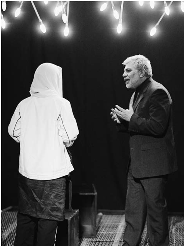
Poor Macbeth de Payam Azizi.

Khomeiny : « Selon la mystique islamique, l'art dépeint la justice, l'honneur et l'équité, en montrant l'amertume des affamés étouffés par l'abondance et le pouvoir. »