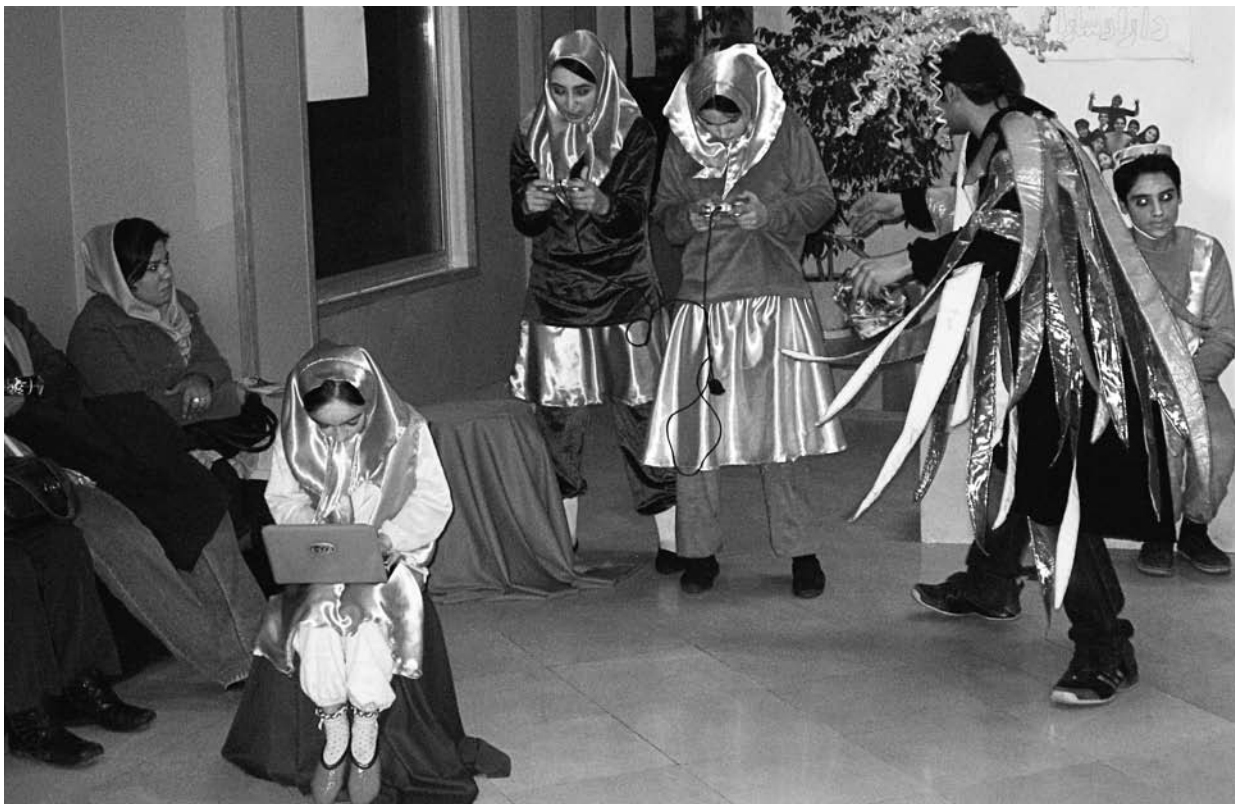
« Même les fillettes jouant dans une pièce pour enfants portent le foulard. » Extrait d'un spectacle donné au Festival international de théâtre Fadji en février 2011.