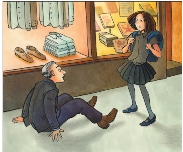
illustration : Caroline Merola

Dans sa chambre, Monsieur Jules ouvrit la porte de sa garde-robe. Tout y était classé par couleurs, et un espace raisonnable et toujours identique séparait chaque cintre. Monsieur Jules s'en félicita car il était tellement plus facile de s'y retrouver ainsi. Son choix s'arrêta sur une chemise aux fines rayures deux tons, dont l'un était un rappel parfait du noir du pantalon sélectionné. Au moment de sortir, Monsieur Jules prit soin de se relaver les mains, plongea son cahier de Sudoku – niveau avancé dans sa poche, enfila ses bottes, puis