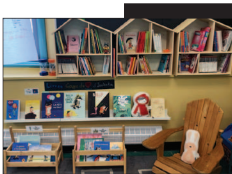
Un environnement de lecture inspirant