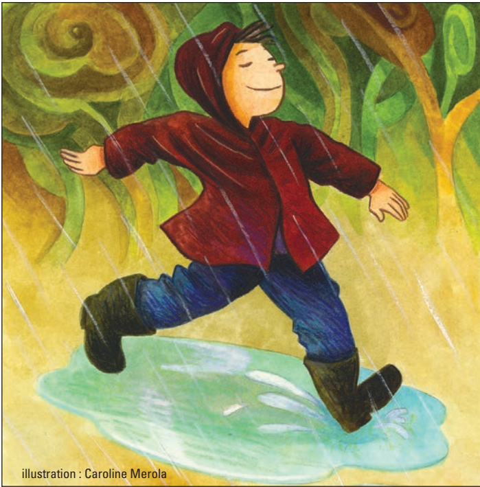
illustration : Caroline Merola

C'est ainsi qu'il vit un magnifique arc-en-ciel percer un nuage. Il y avait forcément de la magie là-dessous, pensa Thomas.