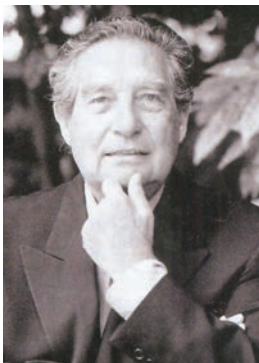
Octavio Paz en 1989