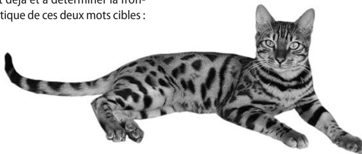
TABLEAU DE DIFFÉRENCIATION LEXICALE

Quelles que soient les méthodes que l'enseignant pratique en classe, il est naturel que les apprenants oublient les mots qu'ils n'ont rencontrés qu'une seule fois. Il est donc nécessaire de les rappeler pour approfondir les traces mémorielles et pour qu'ils soient associés aux mots déjà appris dans les réseaux lexicaux. À la suite de l'activité de différenciation lexicale, nous proposons une autre activité, basée sur la carte sémantique de Sökmen 9 , laquelle permettrait de recycler les mots nouvellement appris et de réviser leur connectivité avec les mots déjà acquis. En effectuant cet exercice, que nous appelons « La toile d'araignée » (voir Exercice de la toile d'araignée), les apprenants complètent les bulles avec les mots de la liste tout en prêtant attention aux liens entre les mots. Par exemple, à l'aide de l'indice « blanc(he) », on peut mettre « neige(s) » au-dessous, mais ce dernier mot n'est pas applicable dans la bulle située au-dessus de « blanc(he) », car « neige » et « chat » ne sont pas nécessairement associés entre eux (voir Corrigé).