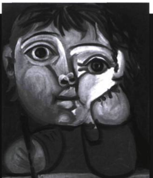
PICASSO, Claude écrivant, 1951, Paris, collection Maya Ruyz-Picasso

L'analyse du texte renseigne également sur la capacité de l'élève à employer la coordination. C'est d'ailleurs le type de relation le plus employé à l'intérieur d'une phrase, dès le début du 2 e cycle :