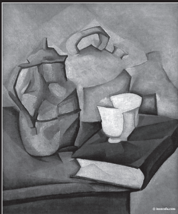
Juan Gris, Le livre , 1911 (Centre Pompidou, Paris).