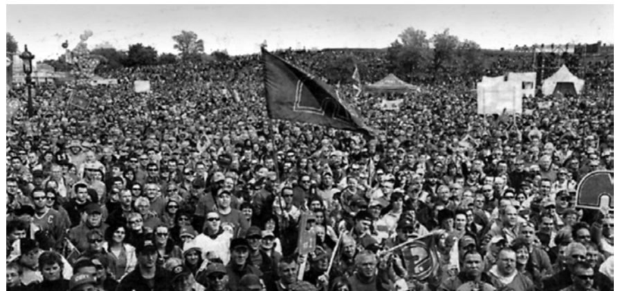
La Marche bleue, Le Soleil , 10 novembre 2010, p. 2.

saire que la sienne se foule, se contraigne et rapetisse pour faire place aux aultres ». Pour comprendre l'usage québécois, il faut se reporter à une particularité de l'usage des verbes pronominaux. En effet, on sait que les verbes pronominaux, au XVII e siècle, étaient encore souvent employés sans le pronom réfléchi, selon l'usage qui avait cours en ancien français ; ils avaient le même sens, avec ou sans pronom, comme c'est encore le cas pour le verbe ( s' )arrêter au Québec ( l'autobus arrête aux passages à niveau ), ou le verbe ( s' )achever ( l'hiver achève ). Exemples du XVII e siècle : « J'affaiblis, ou du moins ils se le persuadent » (Corneille), « Une onde que toujours quelque vent empêche de calmer » (Malherbe), « Elle a pensé périr et écrouler sous le poids de sa propre gloire » (Massillon), « Il avait pensé évanouir » (La Rochefoucauld) 11 .