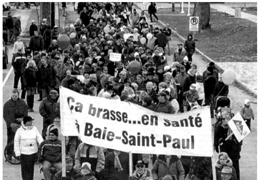
Le Soleil , 8 novembre 2010, p. 7. Photo collaboration spéciale Pierre Rochette (hôpital de Baie-Saint-Paul).