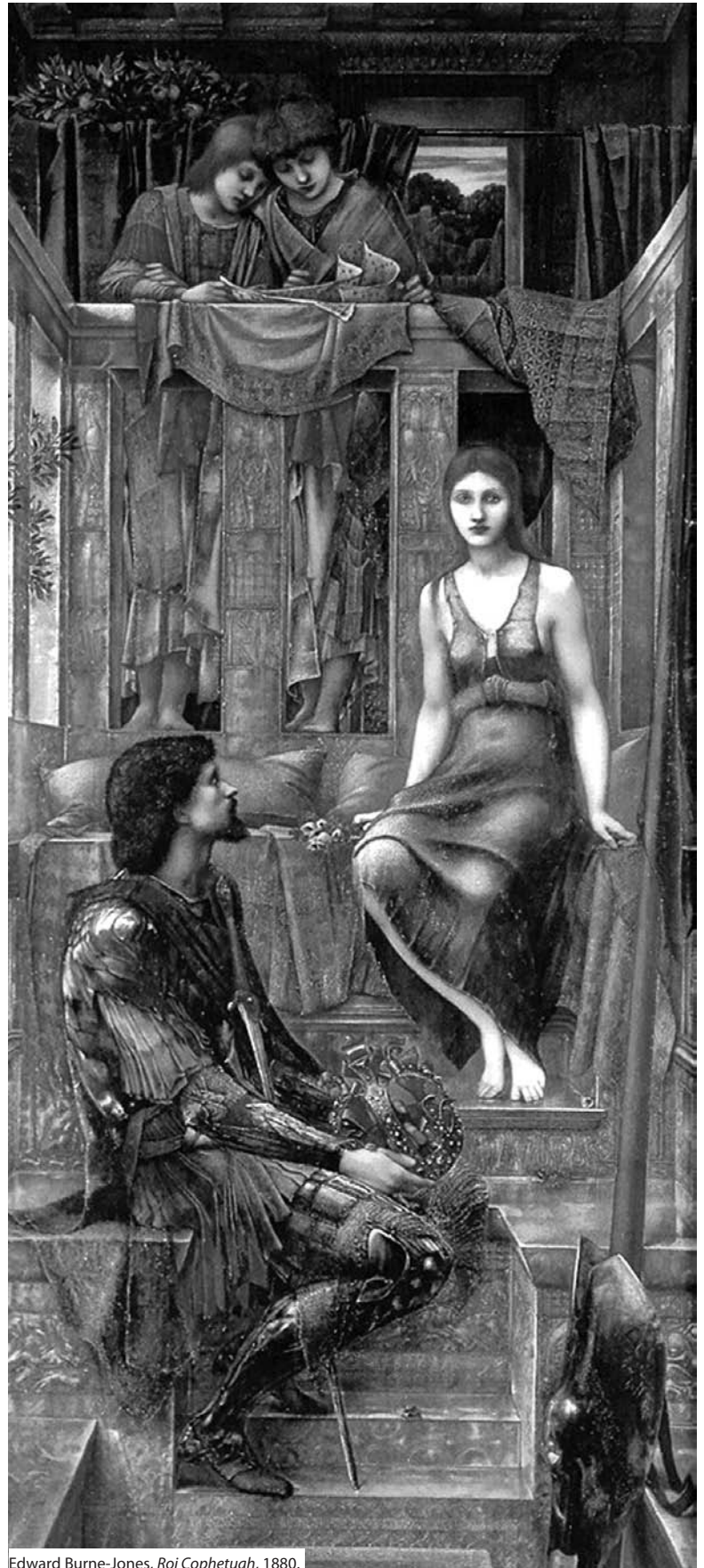
Edward Burne-Jones, Roi Cophetuah , 1880.

Toussaint, 1917, morne journée de vent et de pluie. La guerre s'éternise. Les hommes meurent ou disparaissent dans l'énorme gouffre. Le narrateur, réformé après avoir été blessé, prend le train à Paris pour se rendre dans un village où un ami aviateur en permission lui a donné rendez-vous. Ce Jacques Nueil qu'il connaît à peine, distingué, un peu snob, qui se livre peu, est un compositeur apprécié dans l'avant-garde artistique si créatrice des années qui précédèrent la guerre. Parvenu dans le village quasi désert où se trouve la villa de Nueil, le narrateur n'y trouve pas son hôte. Une servante le reçoit néanmoins. Dans la vaste demeure pleine d'ombre et de mystère, l'attente commence, narrée presque heure par heure, avec à l'arrière-plan la sourde canonnade qui ne laisse pas oublier la présence de la guerre et de la mort. Pourquoi l'hôte est-il absent ? Pourquoi l'invitation ? Qui est cette jeune femme hiératique d'une grande beauté ? Elle le sert à table où il est seul puis le conduit à la chambre et se donne à lui. « Il n'y eut pas de mot échangé. Depuis que j'étais entré à La Fougeraye, elle m'imposait son rituel sans paroles : elle décidait, elle savait , et je la suivais. » (p. 517) 1 Au matin, le narrateur quitte en hâte la villa et cette jeune femme qui demeure l'inconnue, sans savoir pourquoi l'hôte n'est pas venu.