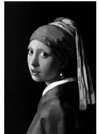
Johannes Vermeer, La jeune fille à la perle , v. 1665, Mauritshuis, La Haye, Pays-Bas.