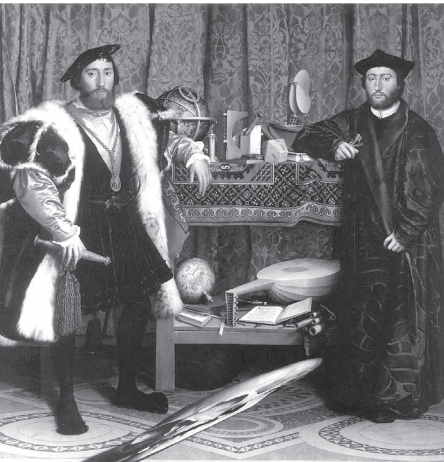
Hans Holbein le Jeune, Deux ambassadeurs , 1533, National Gallery, Londres.