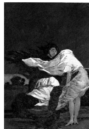
Francisco de Goya, La mala noche (Caprice 36), 1797-98.

Devant la toile de Burne-Jones, le spectateur peut se demander lui aussi : que signifie le tableau ? Mais ici la réponse est plus immédiate et univoque. Dans ce cas, la peinture parle plus directement, mais, quel que soit le charme singulier qu’exerce l’œuvre, avec une richesse, une ambiguïté et une puissance moindres.