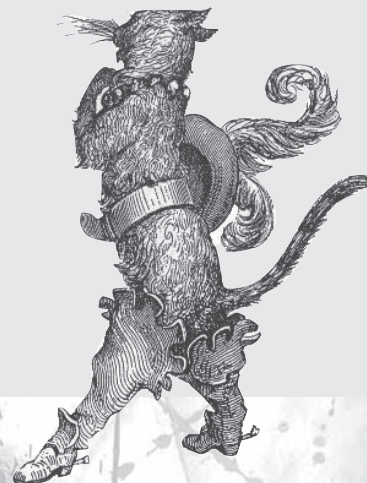
Le Chat botté par Gustave Doré.