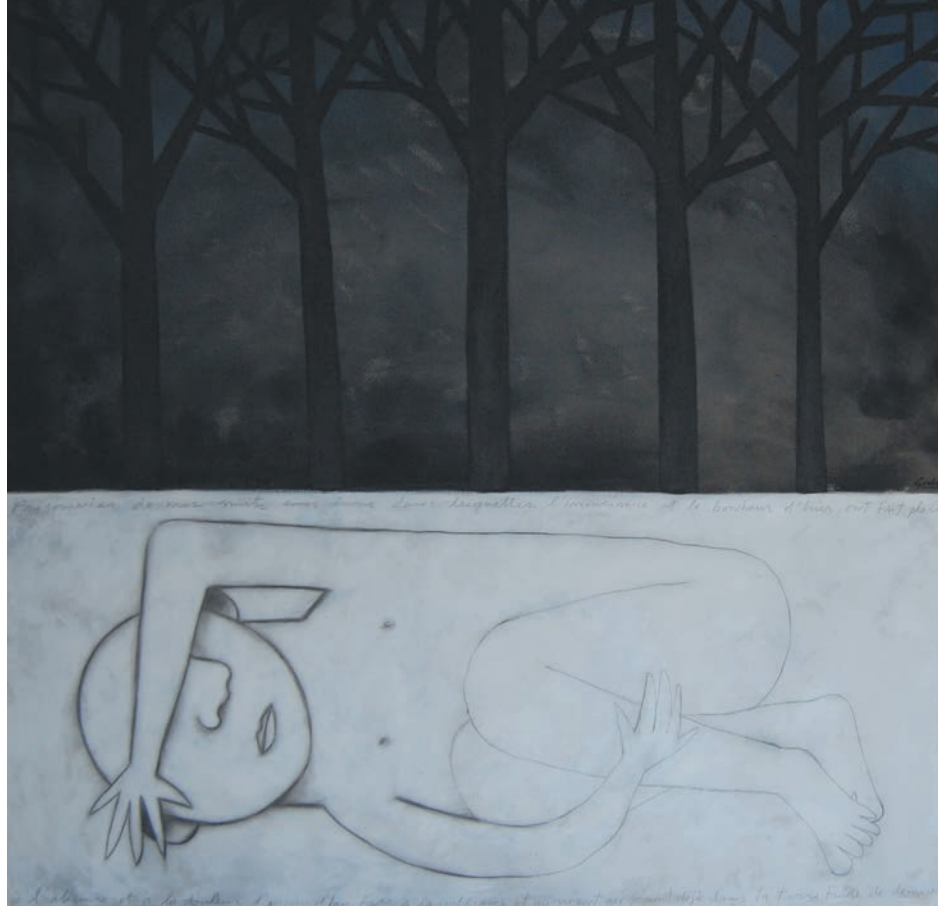
Éric Godin, Mes nuits sans lune , techniques mixtes sur toile, 122 x 122 cm

sont exclues socialement»; «réduire les inégalités qui peuvent nuire à la cohésion sociale»; «favoriser la participation des personnes et des familles en situation de pauvreté à la vie collective et au développement de la société»; «développer et renforcer le sentiment de solidarité dans l'ensemble de la société québécoise afin de lutter collectivement contre la pauvreté et l'exclusion sociale». Partir des plus pauvres devient ici une manière bonne pour tous et toutes de se régir.