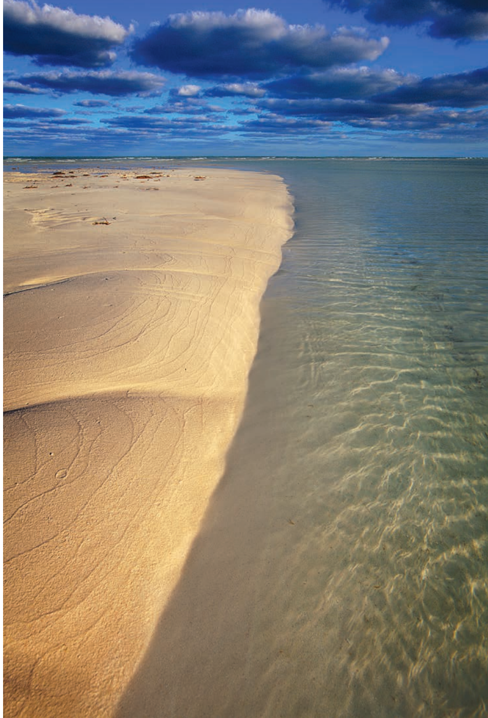
Osire Glacier, Playa Guillermo, Cuba. Artiste invitée du n° 738 (février 2010).

L'immonde est en chacun et en chacune. Mais l'amour du monde tout autant. Nous sommes à tout moment dans la liberté qui nous fait. Aujourd'hui est toujours le temps du choix où se joue l'avenir du monde. La brèche de notre humanité. La vie, en se déployant dans la conscience, fait du sens non pas une réponse à trouver mais l'«oxygène» de notre être, qui nous pousse à répondre par notre vie à une question éprouvante, audible de l'intérieur de soi: «Suis-je le gardien de mon frère... de ma sœur?» La sagesse biblique l'a exprimé ainsi dans la première épiphanie de Dieu: «J'ai vu la misère de mon peuple... J'ai entendu son cri devant ses oppresseurs... Je viens le délivrer» (Exode 3). Écouter le cri de la misère, de l'injustice, de l'oppression, et s'en laisser ébranler; oser voir au-delà des masques des pouvoirs en place; éprouver la vérité nue du sang versé et consentir à y répondre, malgré sa propre misère, malgré la force de l'im-