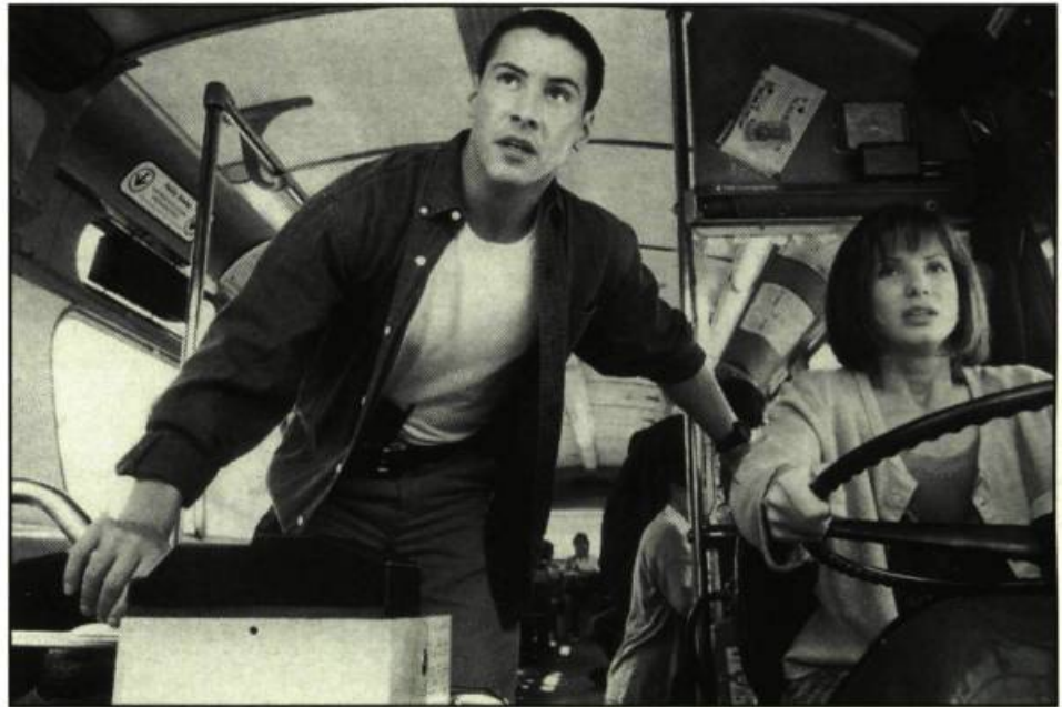
Keanu Reeves et Sandra Bullock

La critique québécoise n'a pas aimé Speed. Souffre-t-on ici d'hypertrophie cinéphilique et de frigidité filmique?