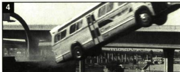
4. Telle une baleine élégante, l'autobus saute.