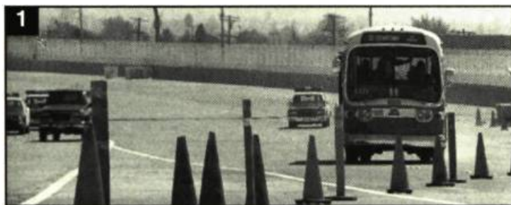
1. L'autobus roule sur l'autoroute en construction.