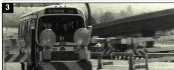
3. L'autobus filmé par téléphoto approche du gouffre.