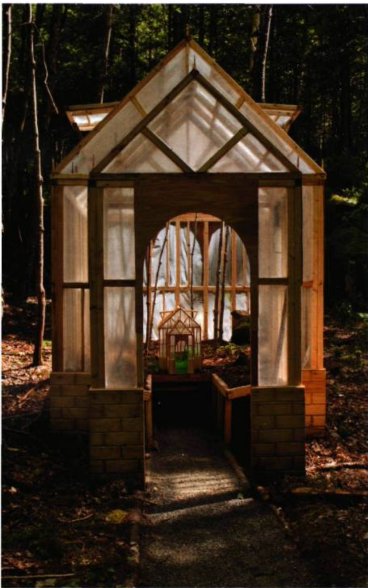
5- Maude Léonard-Contant Paysage gigogne , 2009 Bois, feuilles de plastique, plantes, terre

composée de cannes grossières en bois pourvues d'une poignée en acier. Ce sont les cannes de l'artiste autodidacte aveugle Francisco de la Cal que l'artiste conceptuel Fernando Rodriguez Falcon s'est inventé comme double. Le point aveugle représente pour Falcon l'aveuglement de la société contemporaine, mais celui-ci a confié la réalisation de son idée à l'humble artisan aveugle qui pratique l'arte povera .