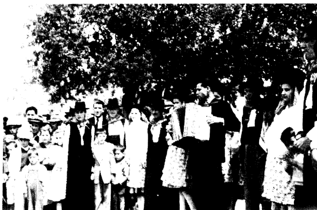
Costumes traditionnels et endimanchés. Chants fado. Économie agricole (mi-avril 1949).

Orlando Ribeiro a signalé l'apport majeur de son congrès: «Marquer la reprise des relations scientifiques internationales dans le domaine de la géographie». À ce point de vue, les choses ont été faites superbement dans ce pays empaillé d'azulejos, recouvert de mosaïques et plein d'humanisme.