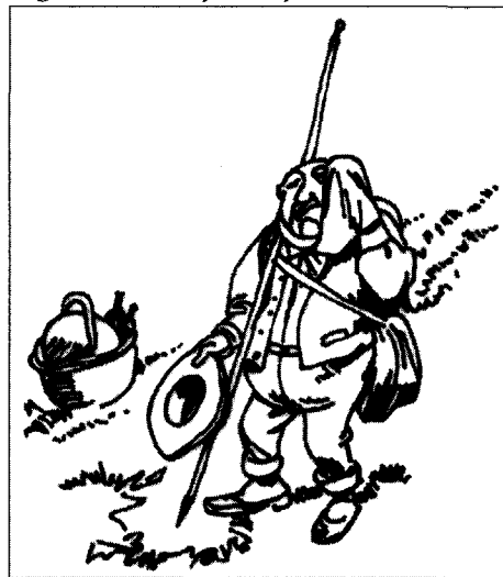
Figure 10 Pique-nique raté, détail

population concernée assumerait consciemment les conséquences. L'argument serait théoriquement recevable si le critère économique n'intervenait pas fortement dans le choix de ce mode d'hébergement – d'où discrimination économique devant le risque – et si les procédures d'information étaient mises en œuvre, ce qui est rarement le cas.