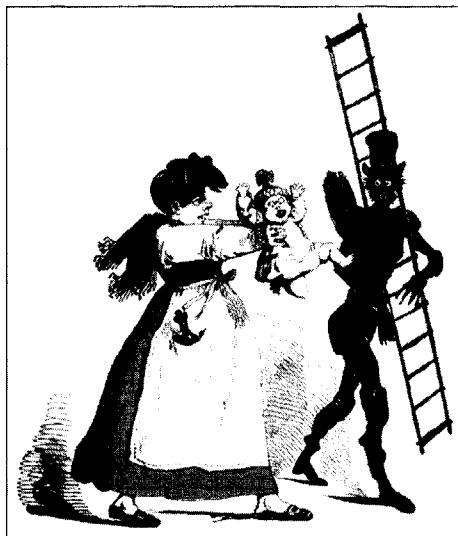
Figure 3 Croque-mitaine ramoneur

et des banlieues, ou même de villes concurrentes... Certaines professions itinérantes inspirent également la plus grande méfiance, comme les ramoneurs, les colporteurs, les charbonniers, les saltimbanques ou les chiffonniers (figure 3). Ils rejoignent d'ailleurs les rangs de ces autres nomades évoluant à l'interface des mondes, les croque-mitaines, dont l'imagerie se développe principalement aux XVIII e et