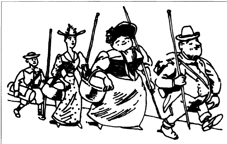
Figure 9 Pique-nique raté, détail