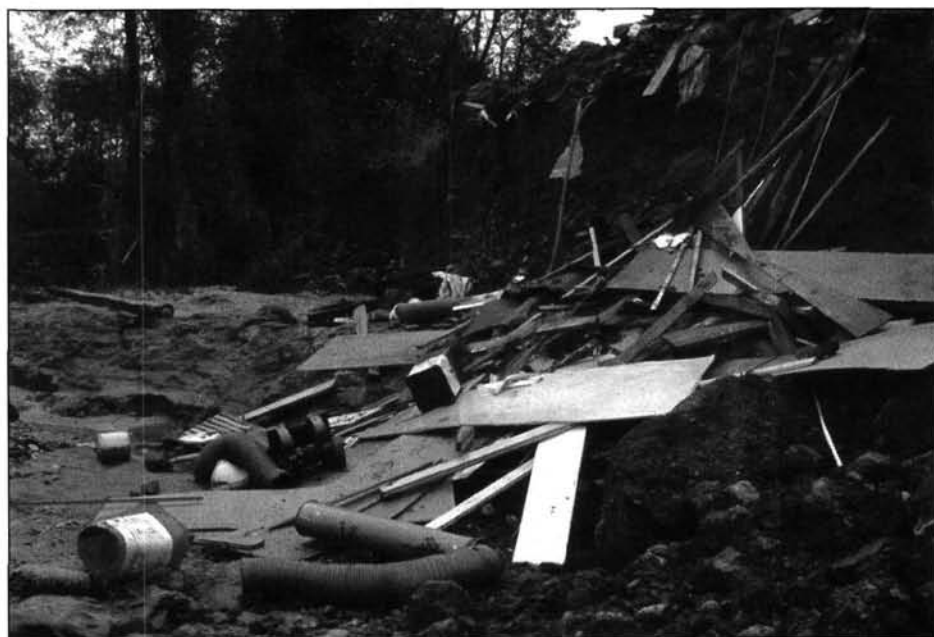
Figure 5 Débordement des affluents de la Loire amont (mai 1996)

météorologique apparaissent sous le terme générique « d'inondation » et ce, malgré des exemples nombreux et récents. Il est difficilement imaginable qu'aucune commune de Haute-Loire n'ait reçu de prescription pour un plan de prévention des crues torrentielles, alors que le phénomène a affecté tous les cours d'eau de l'Yssingelais et de l'Emblavès le 24 mai 1996, entraînant la mort d'une personne et de nombreux dégâts matériels, dont la destruction d'une vingtaine de ponts (figure 5). Rosières et Malrevers, figurant parmi les communes les plus touchées, ne font l'objet d'aucune prescription. De même, on ne relève aucune prescription dans la Drôme (crues du Roubion et du Jabron dans la région de Montélimar en 1988), dans le Var (200 mm d'eau en 3 heures à Bandol, en août 1983) ou dans le Vaucluse. L'Ardèche est également sous-estimée, avec 34 communes concernées par un plan, pour environ 145 campings estimés concernés par la crue torrentielle. Là encore, la commune de Lalevade, où quatre personnes périssent en 1992, ne fait l'objet d'aucune prescription. D'après le rapport parlementaire du député Yves Daugé, remis au premier ministre en octobre 1999, alors que 20 000 communes sont concernées par un ou plusieurs aléas, moins de 20 % des dossiers communaux synthétiques et moins de 2 % des documents d'information communaux sur les risques majeurs ont été réalisés (Daugé, 1999).