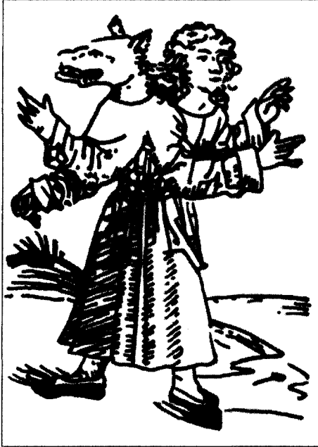
Figure 2 Monstre hybride

(Sexta etas mundi, folio CXCVIII recto).