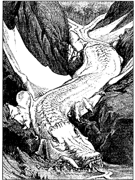
Figure 1 Dragon-glacier