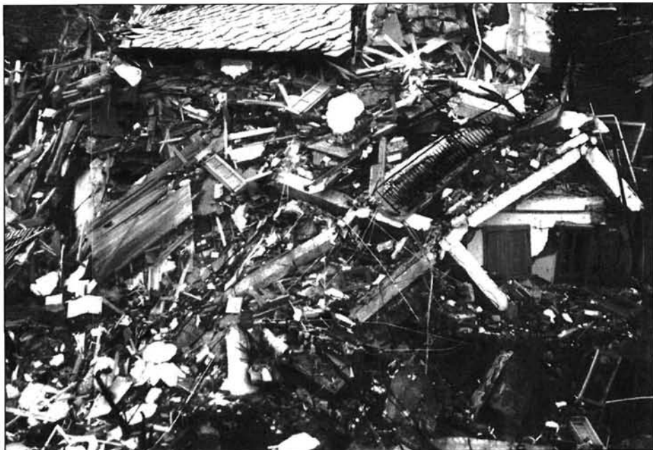
Figure 8 Glissement d'une maison dans la vallée de Cogne (octobre 2000)

Nous nous sommes dégagés du risque reconnu pour réaliser une enquête de localisation portant sur un échantillon de 1804 campings, que nous nous sommes essayé à comparer avec la perception de