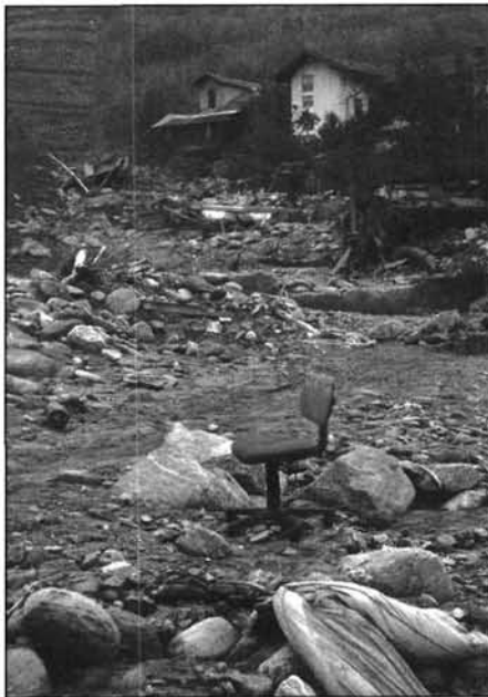
Figure 7 Torrent Saint-Barthélémy