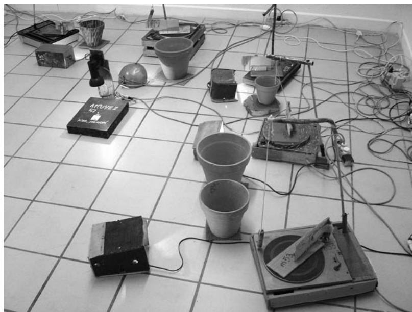
FIGURE 1 Frédéric Le Junter, Le Carillon , 1995. Machines sonores - 2 e série (©Frédéric Le Junter).

2. Jean Tinguely (1925-1991) est un artiste plasticien suisse issu d'une famille modeste et ayant suivi une formation d'apprenti en décoration entre 1941 et 1944 avant d'entrer à la Allgemeine Gewerbeschule (École des arts et métiers) de Bâle. Tinguely expose de manière permanente à partir de 1953, en France. Ses sculptures ressemblent à des machines, tantôt elles-mêmes créatrices d'art, tantôt autodestructrices. Tinguely participe également à des happenings et cofonde, en 1960, le Nouveau Réalisme. En 1968, le Museum of Contemporary Art de Chicago organise une rétrospective de ses œuvres.