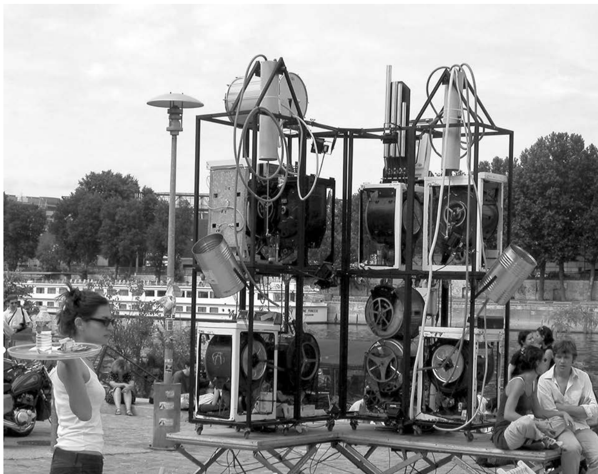
FIGURE 4 Jacques Rémus, Machines à laver musicales , 1991+ (©Jacques Rémus).