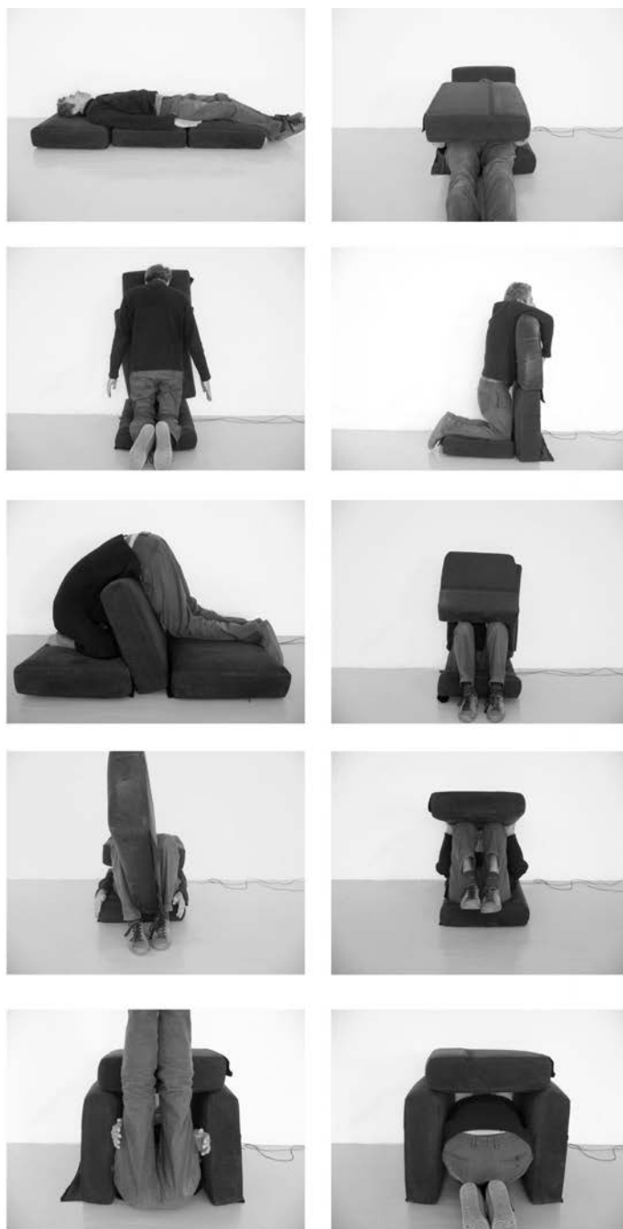
FIGURE 2 Bernard Pourrière, Coussins , 2012 (©Bernard Pourrière).