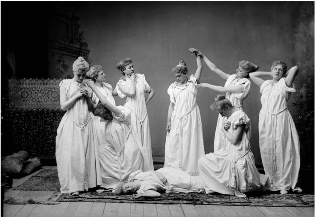
Figure 7. Jules-Ernest Livernois, Mrs. Ed. Foley's Statuary Group , 1893, épreuve à la gélatine argentique, Gatineau. Bibliothèque et Archives Canada.