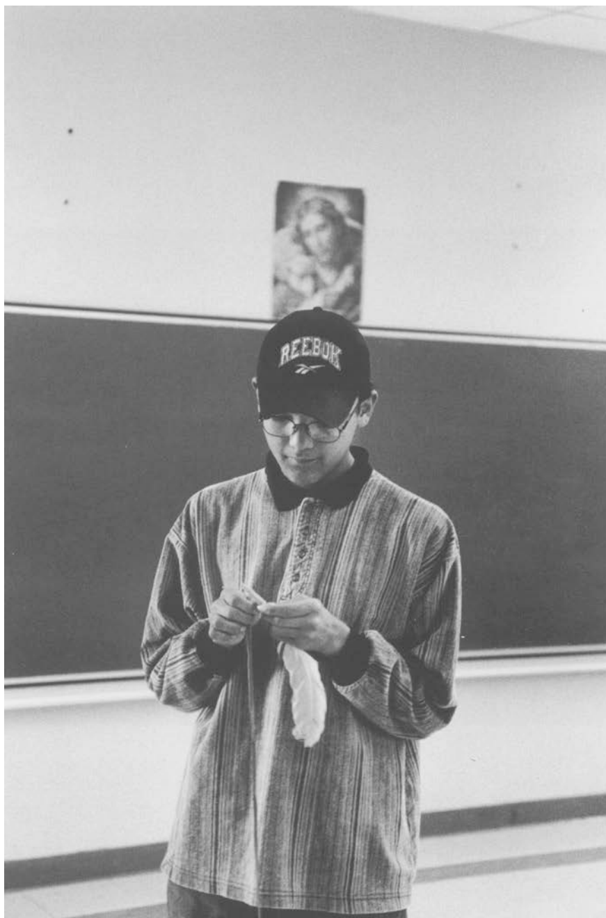
Cette photo d'un élève d'une école de Schefferville montre bien les liens qui unissent la tradition et la modernité »

Il était, à cette époque, de bon aloi de critiquer dans les termes les plus sévères le système séparé des écoles indiennes, surtout le réseau des pensionnats. Il fallait jeter par terre le symbole ségrégationniste pour encourager l'intégration scolaire et citoyenne. Lors des audiences du Comité mixte de 1959-1961, Judy LaMarsh dénonçait le paternalisme outré qui avait rendu les Indiens dépendants de l'État en déclarant qu'ils « se trouvent à peu près dans la même situation que les femmes mariées au siècle dernier » (Canada 1961, n° 5 : 19).