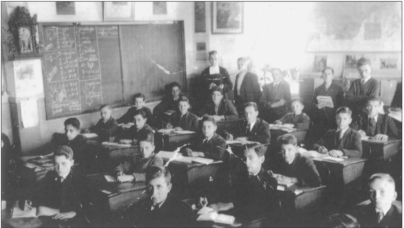
Plusieurs lecteurs reconnaîtront ce type de photo de classe, populaire dans les années 1950. Celle-ci illustre parfaitement la stratégie gouvernementale visant à intégrer les élèves amérindiens aux élèves blancs