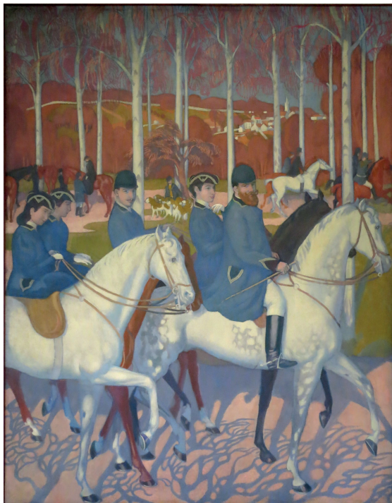
Figure 3 : Maurice Denis, La légende de Saint-Hubert. Le départ (extrait d'un ensemble de sept panneaux), 1897. Huile sur toile, 225 x 175 cm. Saint-Germain-en-Laye, musée départemental Maurice Denis.

On pourrait objecter avec raison que, pour parler d'orientalisme, il faut bien évoquer un ailleurs et non se limiter aux lois qui régissent la matérialité de l'œuvre. De fait, Denis n'a pas renoncé à mettre en peinture des récits, comme dans les panneaux de La légende de Saint-Hubert (figure 3). Ce maintien d'une portée narrative dans ses peintures nous permet de nuancer la citation de Denis : celui-ci établit une sorte de dialogue entre ce qui est évoqué par le récit et la matérialité du tableau. Sa démarche artistique vise à toucher l'esprit par la forme et les couleurs, par les spécificités du médium, tant que par le contenu ou le lien narratif.