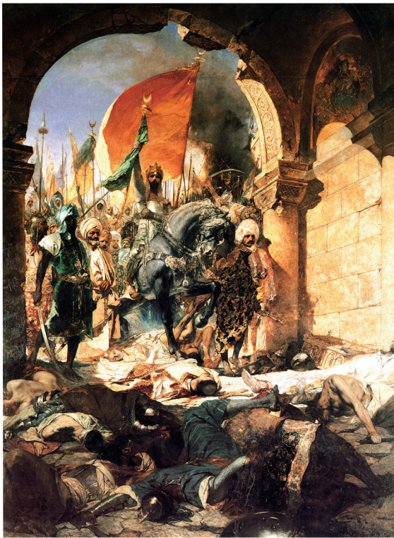
Figure 1 : Benjamin-Constant, Entrée du sultan Mehmet II à Constantinople le 29 mai 1453 , 1876. Huile sur toile, 697 x 536 cm. Toulouse, Musée des Augustins.

Les principales idées de cet article ont d'abord été présentées lors d'une conférence au Musée des beaux-arts de Montréal, dans le cadre de l'exposition « Merveilles et mirages de l'orientalisme ». Les deux commissaires de l'exposition, Nathalie Bondil et Axel Hémery, mentionnent dans la préface du catalogue que l'Orient de Benjamin-Constant a été déclenché par un voyage à Grenade et à Tanger, qui a agi sur l'imaginaire du peintre : « ethnographie tirée vers le pittoresque, fascination sulfureuse de la femme orientale fantasmée, peinture d'histoire ponctuée de violences et d'arbitraire » (Bondil 2014, p. 21). Un peu plus loin, dans le chapitre consacré à « La palette du peintre », Hémery ajoute que le tableau intitulé Entrée du sultan Mehmet II à Constantinople le 29 mai 1453 (1876 ; figure 1) « n'est pas la première œuvre orientaliste de Benjamin-Constant, mais [que] c'est celle qui bénéficiera du plus grand retentissement et qui lancera le débat sur la nature de l'art de coloriste du peintre » (dans ibid. , p. 30). Voulant se démarquer des représentations traditionnelles, le peintre prend appui sur l'orientalisme pour affirmer l'originalité de sa démarche coloriste. Rétrospectivement, lorsqu'on regarde l'importance que prend la couleur chez les peintres du tournant du xx e siècle, cette démarche prend valeur de « symptôme culturel », au sens où l'emploi Ernst Gombrich dans son Histoire de l'art (2001).