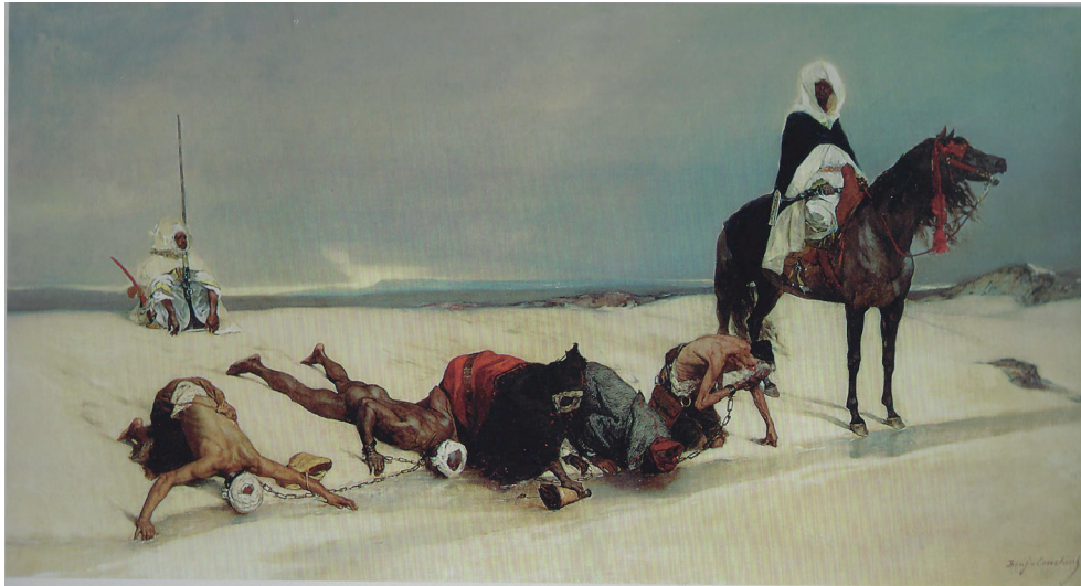
Figure 5 : Benjamin-Constant, La soif . Prisonniers marocains, 1878. Huile sur toile, 117,2 x 213,4 cm. Signé b.d. : Benj-Constant. Londres, Christie's, 18 juin 1998, lot 3.

Dans les années 1910, c'est le musicien Maurice Delage, dont la famille possédait des industries en Orient, qui fera un voyage au Japon et en Inde. Dans ces pays, il entend et il est touché par plusieurs musiques traditionnelles. Mais, contrairement aux compositeurs du XIX e siècle, Delage souhaite reproduire assez fidèlement les timbres, les échelles sonores, les textures et les rythmes des musiques indiennes. À la différence de Fauré, son Orient n'est pas fantasmé, il s'ancre dans la réalité sonore de l'Inde et s'écarte d'une représentation musicale de la sensualité féminine.