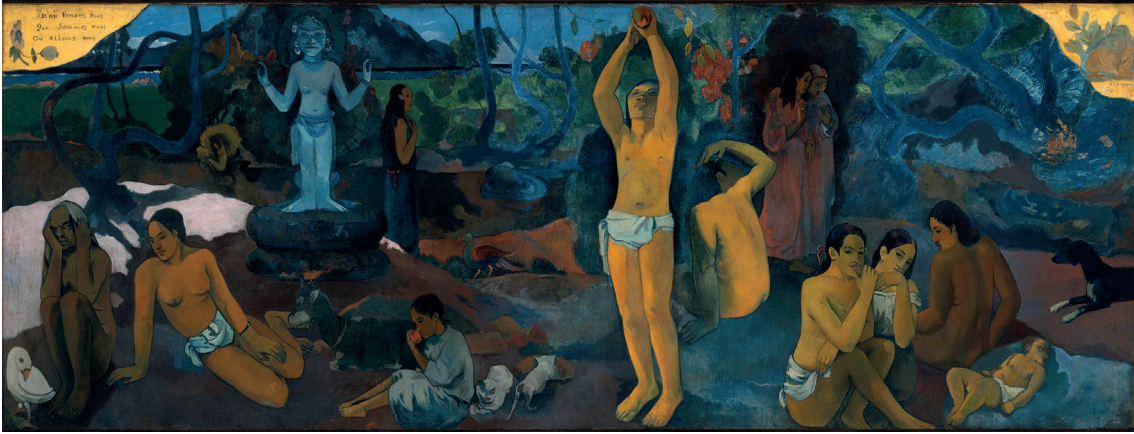
Figure 6 : Paul Gauguin, D'où venons-nous ? Que sommes-nous ? Où allons-nous ?, 1897-1898. Huile sur toile, 139,1 x 374,6 cm. Boston, Musée des beaux-arts de Boston.