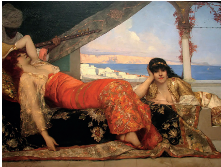
Figure 7 : Benjamin-Constant, La favorite de l'émir, vers 1879. Huile sur toile, 142,2 x 221 cm. Signé b.g. : Benj-Constant. Washington, National Gallery of Art. Courtesy of the United States Naval Academy Museum. 2010.95.1.