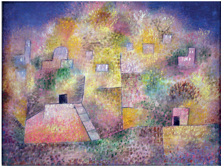
Figure 8 : Paul Klee, Jardin d'agrément oriental, 1925. Huile sur carton, 42,3 x 51 cm. New York, The Metropolitan Museum of Art.

Nous pouvons étendre les conséquences de cette approche à l'extérieur du domaine de la mélodie, en dehors de toute référentialité à un texte. Tirée des Estampes (1903) pour piano, « La Soirée dans Grenade » appartient à la catégorie de trace 22 . Le titre – qui est d'ailleurs placé à la fin, comme simple suggestion – demeure l'un des rares moyens qu'utilise Debussy pour évoquer l'exotisme. Certes, le rythme de la habanera, au début de l'œuvre, évoque clairement l'Orient, mais il est ensuite tellement décontextualisé qu'il devient un simple déclencheur de sensations. Debussy pousse ici l'avant-garde à une conséquence assez radicale, en sortant du cadre étroit de la représentation figurative pour ouvrir le motif à un réseau de significations beaucoup plus ouvert. Pour reprendre la citation de Bartoli par la négative, on pourrait dire que la habanera devient un paramètre isolé qui ne parvient plus à s'imposer dans un réseau de figures exotisantes (Bartoli 2000, p. 65). Le titre du recueil est d'ailleurs indicateur de cette attitude créatrice : l'estampe est une gravure, une image imprimée sur papier à partir d'une planche de bois ou d'une plaque métallique. L'estampe est la trace laissée par un modèle. Pour Debussy, la partition est conçue comme cette plaque, alors que le son s'imprime chez l'auditeur. L'œuvre, c'est finalement la trace laissée par le son de celui qui joue en celui qui écoute.