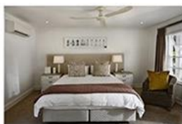
2. Une chambre