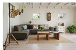
6. Un salon

L'activité comprend cinq étapes, dont la première se fait individuellement. Pour ce qui est des étapes subséquentes, elles se déroulent en équipe de trois, et les équipes changent à chaque étape.