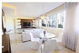
1. Une salle à manger