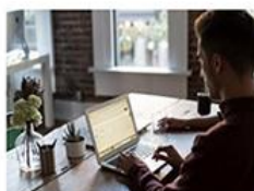
5. Un bureau