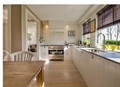
4. Une cuisine