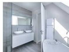
3. Une salle de bain