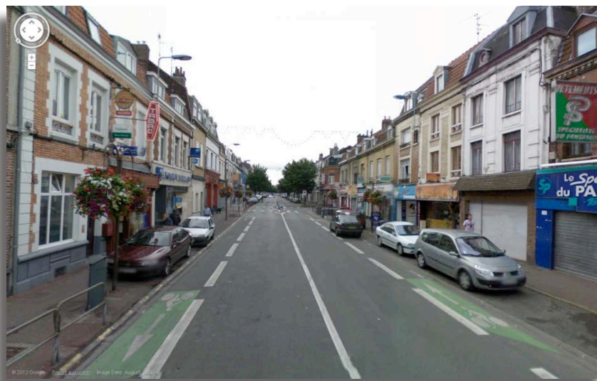
Fig.2 : Le quartier de Fives, dans la banlieue populaire de Lille (département du Nord, 59), avec sa principale artère décrite dans Plouk Town et son café, un des lieux clés du texte d'Ian Monk.