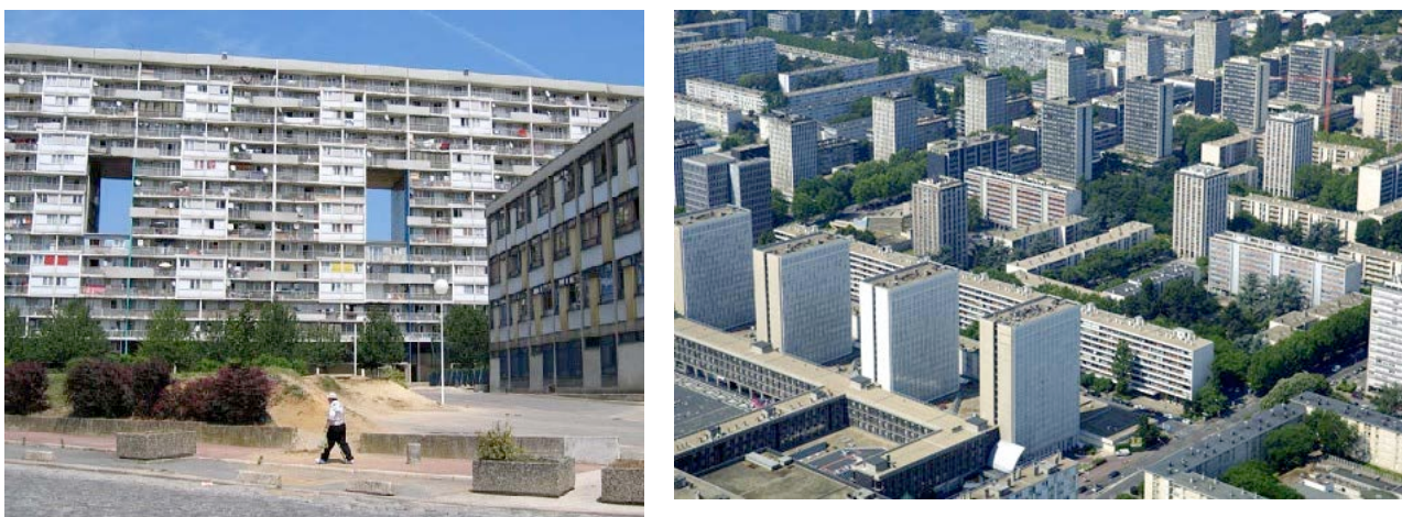
Fig.1 : les tours des cités de La Courneuve (aujourd'hui détruite donc appartenant à un passé historique) et de Sarcelles, dans la banlieue parisienne, respectivement en Seine-Saint-Denis (département du 93) et dans le Val-d'Oise (département du 94).

De quel imaginaire urbain le texte monkien dresse-t-il le portrait ? L'imaginaire urbain de Plouk Town , c'est celui de la banlieue périphérique de Lille où habite l'auteur Ian Monk dans la vraie vie. Pourtant, un recours à une documentation réelle (Fig. 1 et 2) montre vite l'écart entre l'imaginaire des tours peintes dans Plouk Town et la réalité du quartier périphérique de la banlieue lilloise (Fives) décrite dans le texte monkien :