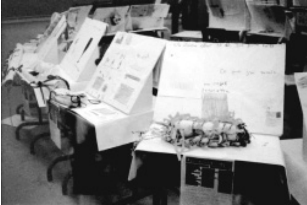
Figure 8 : Vue d'ensemble de l'exposition « Les objets de la classe de Raymonde », premier atelier, 1996. École Innalik, Inukjuak.

commande de conception comme panneaux d'exposition. En illustrant les motivations sous-jacentes au concept de design, ces dessins mettent en scène le lieu et la façon d'utiliser l'objet ; ils expliquent ainsi l'origine et les modalités d'utilisation de l'objet créé en illustrant son lieu d'utilisation, « où j'aime aller », l'activité qui fait