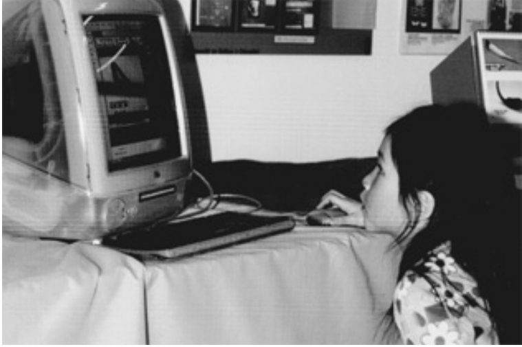
Figure 9 : Jeune visiteuse consultant la banque de données Design et culture matérielle. Coopérative de Kangiksualujuaq.