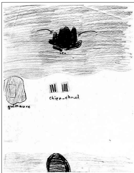
Figure 2 : Dessine un ou des objets que tu aimes beaucoup. « J'aime des saucisses et des guimauves que l'on fait griller sur un feu. »

reliées à leur vécu. La commande de design simule une situation : « où aimes-tu aller? », « qu'aimes-tu faire dans ce lieu? », « de quoi as-tu besoin pour faire cette activité? ». La formulation des réponses à ces questions se fait par dessins, procédé qui permet à l'enfant de se transposer dans l'expérience particulière qu'il a choisie et d'en communiquer l'essence par l'expression artistique. Une dernière commande est ensuite passée : « dessine une nouvelle façon d'amener les choses dont tu as besoin pour faire cette activité » ; il s'agit de l'étape de conception proprement dite.