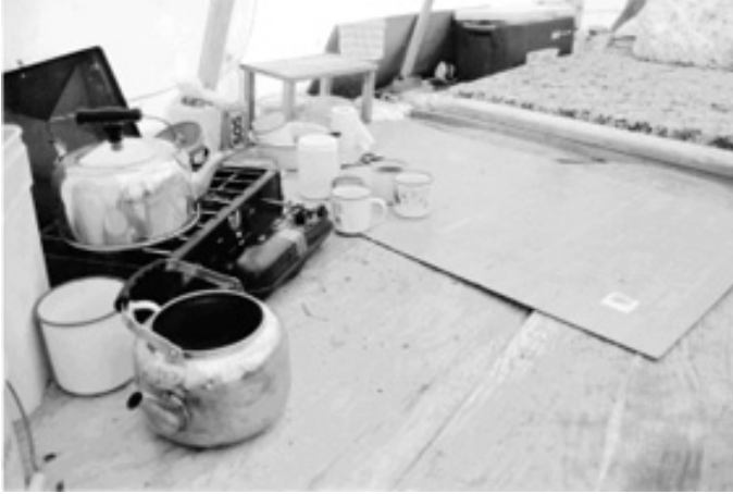
Figure 6 : La tente dans le land , un mode de vie actuel.

Lors du second atelier, chaque élève cherche d'abord les informations concernant son travail dans la banque de données qui profile en fait une sorte de lignée généalogique des objets. Trouver sa propre création à l'intérieur du musée virtuel est un acte symbolique important permettant l'inscription au monde, à la fois comme