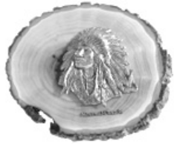
Figure 1 : le grand chef sur bûche, vendu dans toutes les boutiques de souvenirs d'Amérique du Nord

Une expérience récente m'a permis de constater encore une fois cette tendance. Dans une boutique d'artisanat située dans une communauté amérindienne, j'ai trouvé sur un étalage de colliers, à travers les pointes de flèches et les plumes sculptées dans du panache d'original, une minuscule motoneige réalisée à la perfection dans ce même matériau. J'ai voulu l'acheter puisqu'elle était une parfaite illustration de l'expression d'un vécu actuel réalisé dans un médium traditionnel. Le propriétaire de la boutique, surpris de mon intérêt, m'a dit avoir refusé que le jeune sculpteur lui apporte ses créations, comme s'il avait commis un sacrilège en exprimant autre chose que ce à quoi on s'attend, non pas de sa part, mais de ce qu'il représente. Cette attitude m'apparaît comme une volonté d'élimination, maintenant perpétrée de l'intérieur comme de l'extérieur des communautés autochtones. J'ai alors réalisé que ce jeune créateur était en fait en situation de double contrainte : impossible de s'exprimer dans la société dominante, et encore moins dans la sienne. Une situation intenable qu'accentue l'attitude des musées, cantonnés dans leur rôle de conservation plutôt que de transmission vivante.