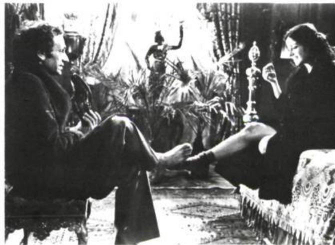
Maman a cent ans.