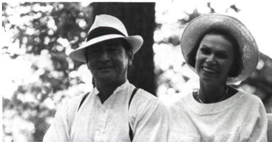
Monique Mercure et August Schellenberg

« L'aspect intéressant du cinéma, c'est qu'on peut donner d'une façon très éphémère une excellente représentation ; et je dis éphémère parce que ça ne va durer que deux ou trois minutes, mais malgré cela c'est un grand moment de création. » (Monique Mercure, Cinéma Québec , Vol. 6 n° 1, 1978)